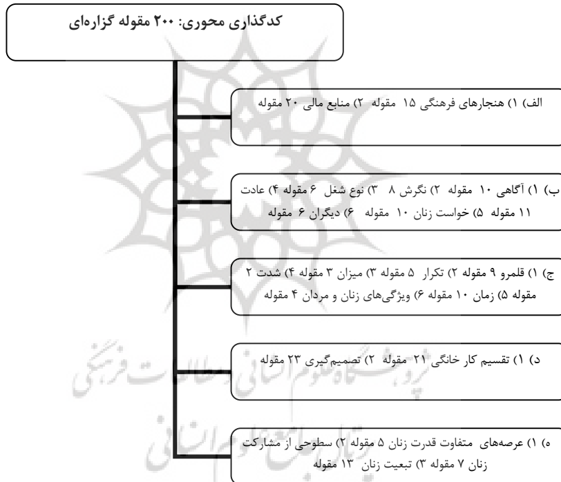
نمودار ۱: کدگذاری محوری مربوط به داده‌های شرکت‌کنندگان مرد

تحلیل با کدگذاری باز شروع شد که بررسی بخش‌های کوچکی از یک متن که از کلمات، عبارات و جملات ساخته شده بود. به دنبال کدگذاری باز، کدگذاری محوری شروع شد که اطلاعات را «به روش‌های جدید با ایجاد اتصالات بین یک دسته و زیردسته‌های آن» به هم پیوند می‌داد (همان، ۹۷). از این فرآیند، دسته‌هایی به وجود آمد و برجسب‌هایی برای آن‌ها تعیین شد. سرانجام، کدگذاری انتخابی اتفاق افتاد و یادداشت‌برداری و دسته‌بندی برای تسهیل در کدگذاری انتخابی استفاده شد. سپس با خواندن مجدد یادداشت‌ها و دسته‌بندی آن‌ها، محقق توانست کشف کند که چگونه رمزها جمع شوند تا دسته‌هایی را تشکیل دهند و چگونه این دسته‌ها با هم دور یک دسته مرکزی و اصلی جمع شوند (استراوس و کوربین، ۱۹۹۰). هر روش کدگذاری در GTM، مستلزم انواع گوناگون سؤال‌ها با طیف‌های مختلف است. نمودار شماره ۱، کدگذاری محوری مربوط به داده‌های شرکت‌کنندگان مرد را نشان می‌دهد.