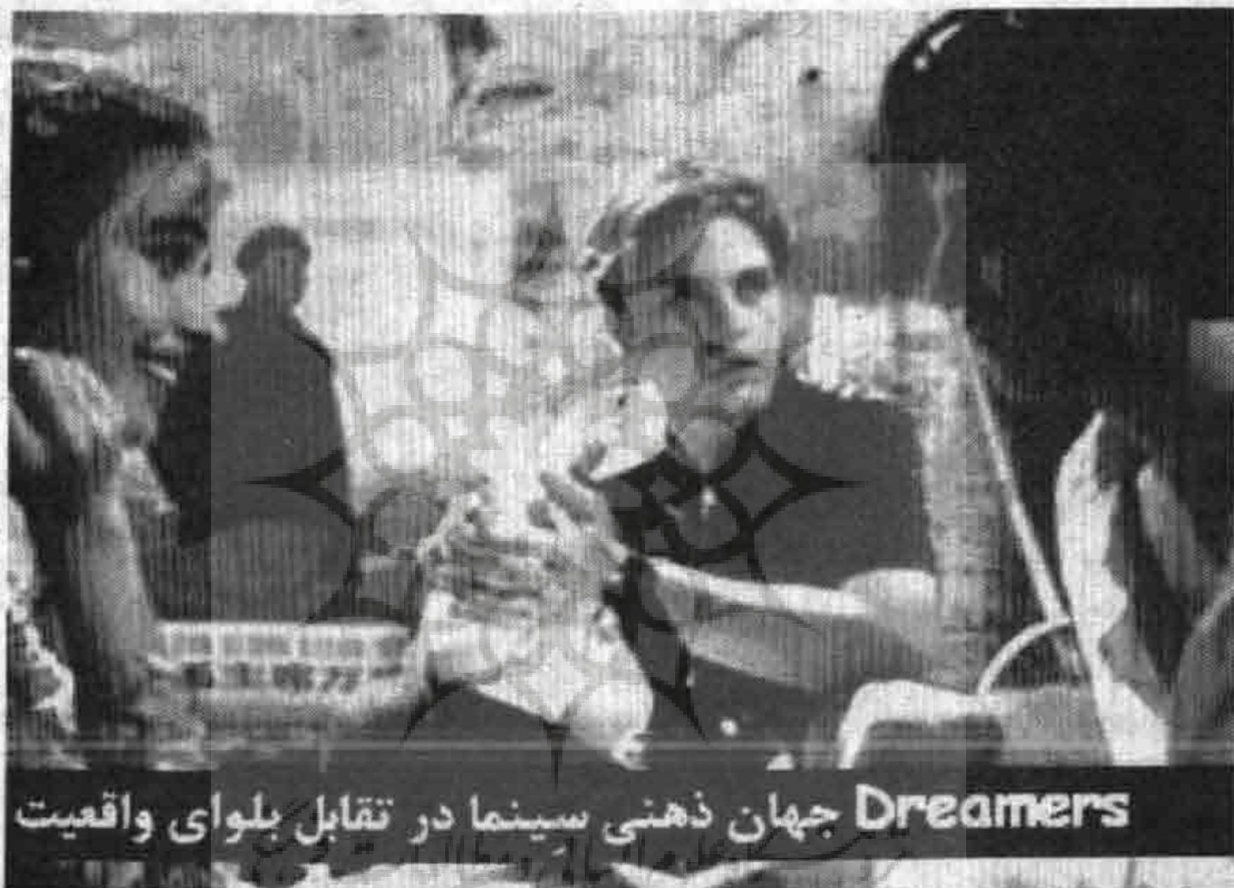
Dreamers جهان ذهنی سینما در تقابل بلوای واقعیت

باالشخصه سعی کرده ام در تمامی لایه های زندگی رعایت کنم . تقریبا چند ماه است که با پاورقی (سینما ، بایگانی تاریخ ) در خدمت شما هستم . این سیر نیز حکایت تاریخ است از منظر سینما . مدیومی که یک قرن و اندی است بازتاب تاریخ را در آیینه های خود به بشر می نمایاند و نقش تاریخ را در روایتهای خود ثبت می کند . من نیز سعی نمودم به حد وسع خویش راوی این حکایتها باشم . و همین حکایتهاست که بر سه محور می چرخد . سینما ، تصویر ، آوای سخن . آمده بودم تا سخن بگویم ، خیلی حرفها به دهان نیامد ، تصویرش کردم ، خیلی نواها به نوشتن نیامد ، قابش کردم و به تاریخ دوختم ، سینما خود زبانی منحصر به فرد است ، زبانی گلوبالیزه شده ، می توانی در ناف خاور میانه بنشینی و از فاصله ی غمگنانه ی بشر مدرن