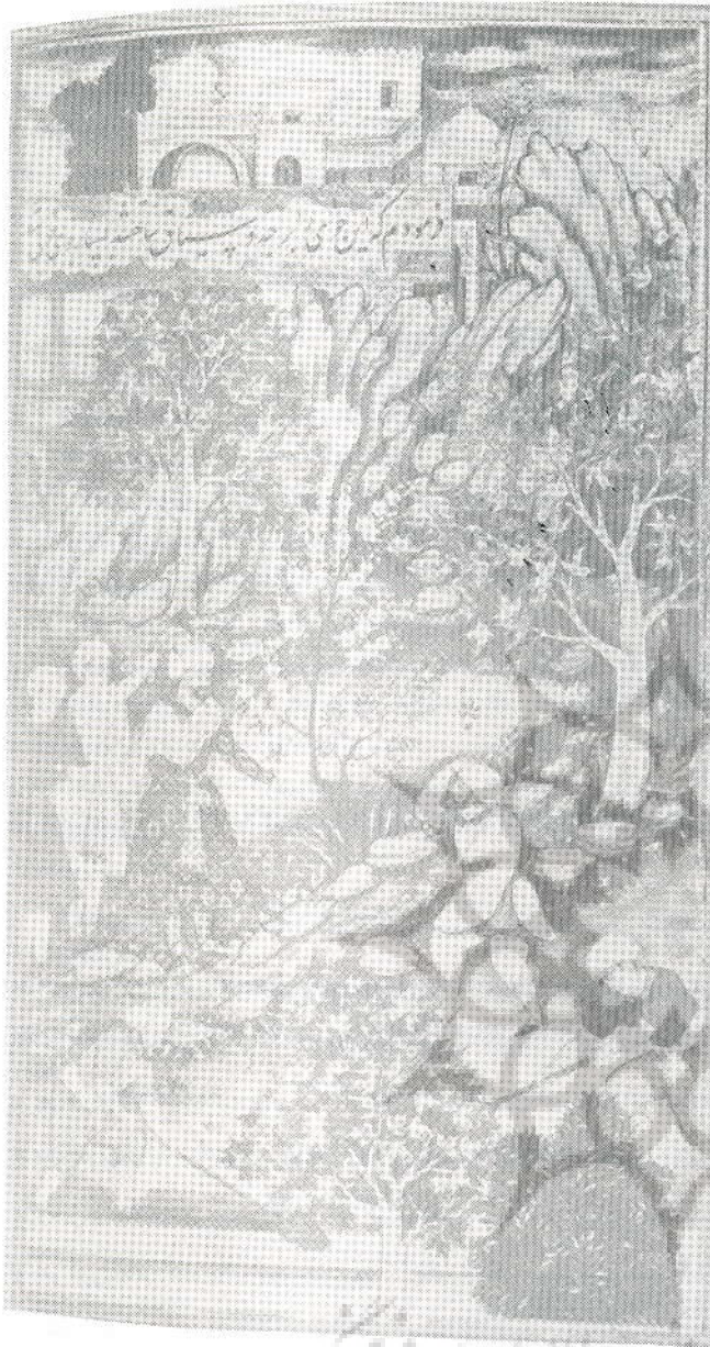
مینیاتور تیمور هنگام بازدید از باغ وژا

دستیابی به پشت بام برای تعمیرات لازم بود و این به توسط راه پله هایی سر پوشیده امکان پذیر می شد. ۲۰ گاه موارد استفاده از اشکالی که بر روی پشت بام تصویر شده اند نشان داده شده است. ۲۱ بر روی پشت بام بسیاری از کوشکها تصویر ساختمان فانوس ماندنی مشاهده می شود ۲۲ (کل آفرنگ) که بجز تابیدن نور به داخل در صورت