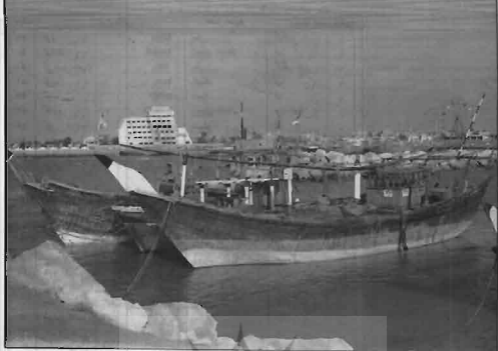
شعبه های ماهیگیری در ساحل دریا، محله جبره، بوشهر شعبه های موزه بازار ماهیگیران توسط گلخان بومی ساخته می شود. بوشهر