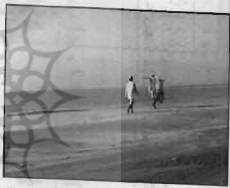
ماهیگیران تور خود را حمل می‌کنند تا در قطب مناسبی از دریا بگسترانند. لاولی ۵۰