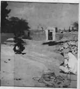
تعمیر بندهای تور پس از صید، لاری بالا