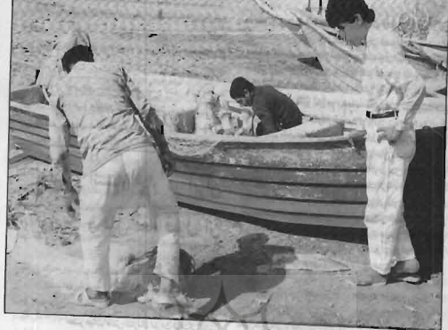
ماهیگیران در حال آماده کردن وسایل خود برای رفتن به دریا، بندرگاه

ملاح و ماهیگیر هسبر خود را از بین دخترهای دیگر ملوانان و ماهیگیران انتخاب می‌کنند. سن ازدواج معمولاً بین ۱۵ تا ۲۰ سالگی است. هر مرد بعد از ازدواج تأمین زندگی خود را برعهده می‌گیرد.