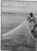
صید ماهی در ساحل دریا، بندرگاه