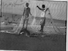
۵۰ ... .. ساحل مراکش. لاولی ۵۰

روش ماهی مختلف صید ماهی توسط تورهای ماهیگیری متنوع می‌باشد از آن جمله روش صید سه کار (sēkār) است. برای بهره‌برداری از این روش سه کار باید انجام پذیرد. ۱- نصب تعداد زیادی تیرهای چوبی به صورت عمود و ردیف هم در دریا