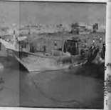
لیج‌های ماهیگیری در ساحل دریا، محله بندر، پوشه‌ری