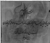
خوشنویس - فریده حکیم پور