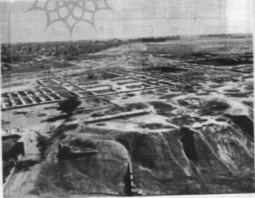
۲- منظره عمومی محوطه باستانی شوش و کاخ آپادانا