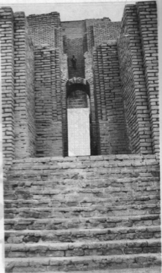
۱- ورودی معبد ابلامی چغازنبیل