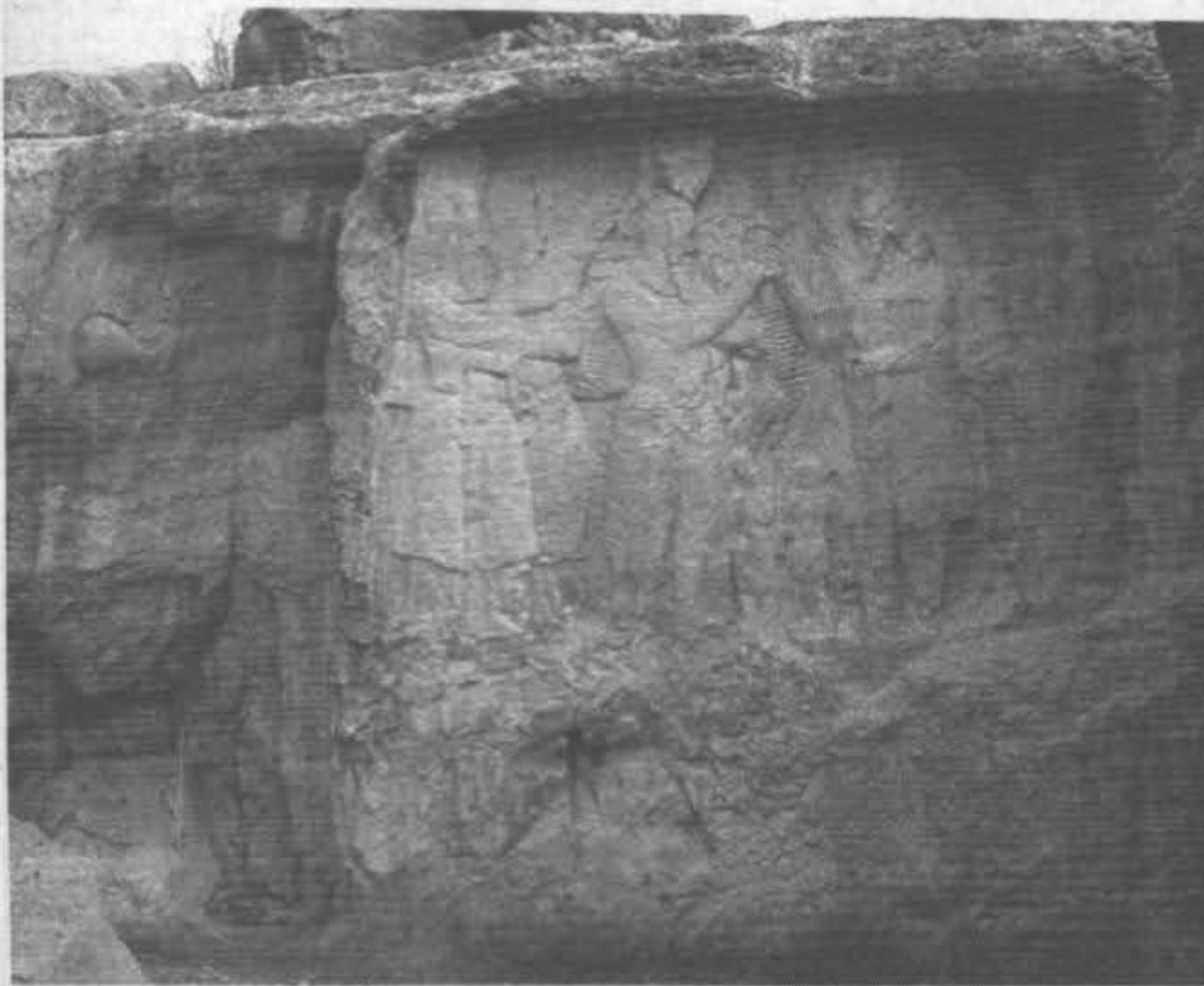
نقش برجسته دیهیم بخشی به اردشیر بابکان و نقش برجسته کرتیر