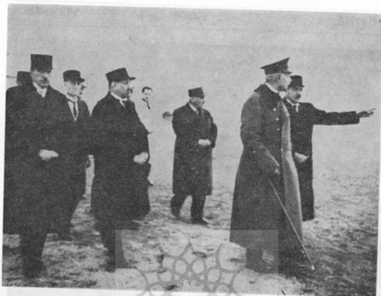
آن روزی است که رضا شاه کبیر زمین متناسبی را در شمال تهران قدیم برای بنیان گذاری دانشگاه تهران انتخاب میفرمود

پیش از تراوش این گونه گفتارهای نغز بخوبی میتوان پی برد که دین و دانش در میان این مردم ترقی و مذهب ریشه عمیق داشته و بهر ممد از بسا زمانهایی بوده اند که در آنجا علم و ادب فرامیگرفتند، خواه نام آن جایگاه را دانشگاه گذاریم یا آتشگاه.