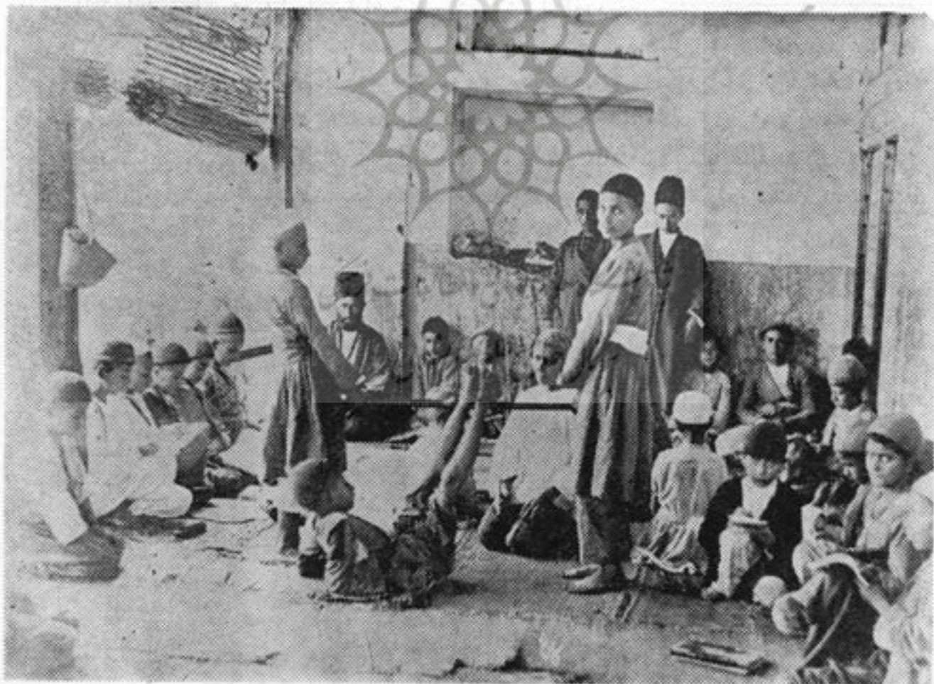
منظره ای از مکتب خانه و فلک کردن بچه مکتبی

ملاحی غالباً عینکی که بادورشته نخ بگوشهایش بسته میشد، به نوك بینی داشت و به خواندن قرآن و یا اسکندرنامه و کتا بهای نظیر آن تظاهر میکرد، از آن نظر «تظاهر» میگویم که بعدها وقتی بزرگ شدیم و سوادى پیدا کردیم دانستیم که این ملاحیها اصولاً ترکیب حروف و کلمات را نمی شناختند بلکه عباراتی را از حفظ کرده اند و «علی العمی» میخواندند. باری، مهمترین مطلب مورد توجه ملاحی این بود که هنگام صرف ناهار ببیند هر کدام از ما در قایمه چه داریم؟ آری، او از قایمه غذای ماسهم میبرد... از نظر ملاحی آن بچه مکتبی عزیزتر بود و مورد محبت قرار میگرفت که از درون قایمه اش خوراک بهتری به پیشگاه استادانه اش عرضه شود. اگر خدای ناخواسته بچه مکتبی نان و پنیر می آورد و بدینگونه، کدورت خاطر ملاحی فراهم میشد، پس از صرف ناهار بکوچکترین بهانه بی باید آن بچه مکتبی «فلک» شود و چوپ بخورد (اگر سابقه چوپ و فلک را نداشته باشید بمنظره ای که گراور شده توجه فرمائید.)