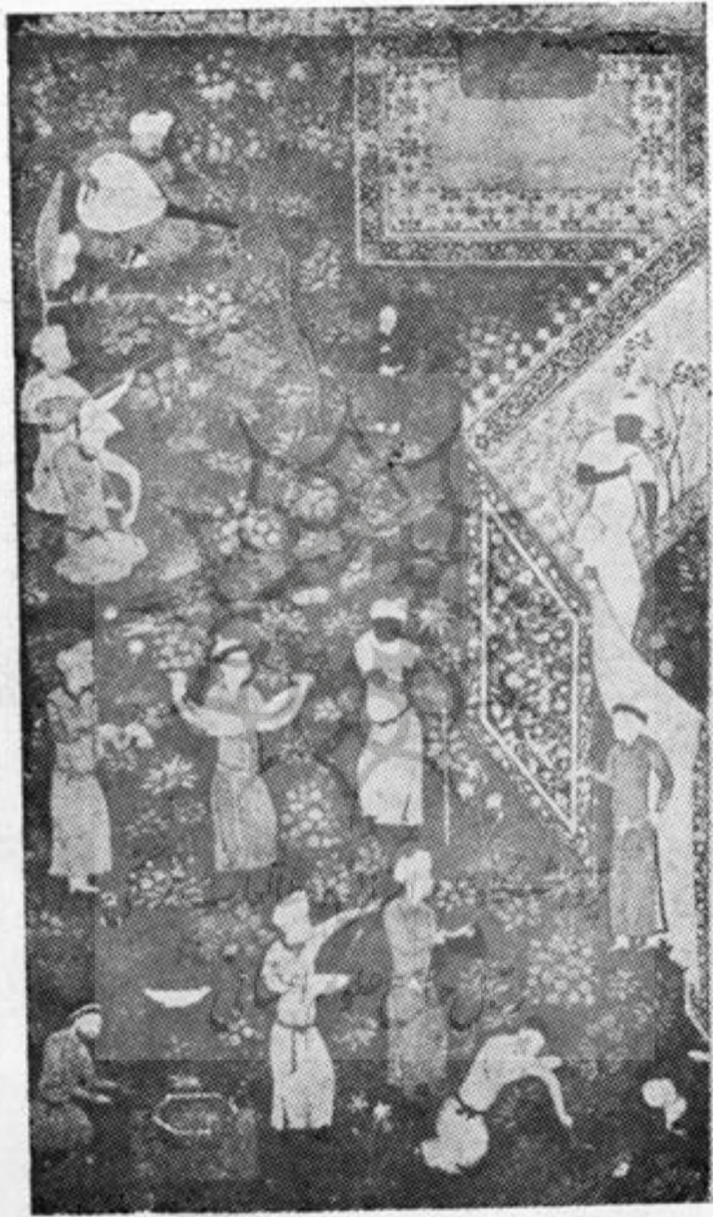
منظره باغ - کار بهزاد (قرن نهم هجری)