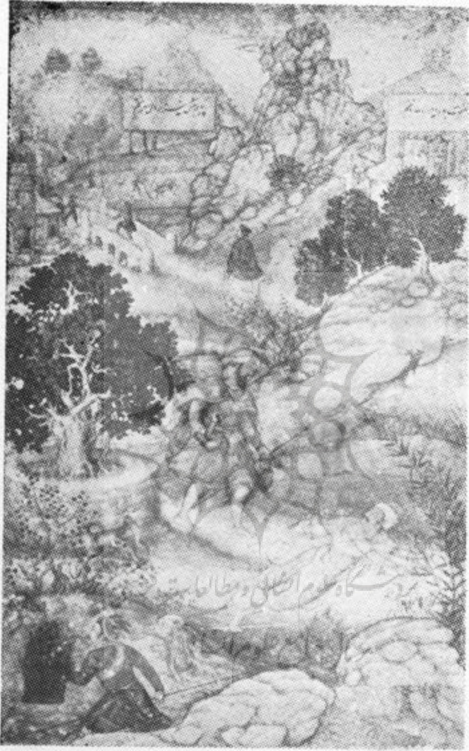
نقاشی مینیا نور۔ کار بساون۔ مکتب مغولی ہند (قرن ۱۶ ہجری)