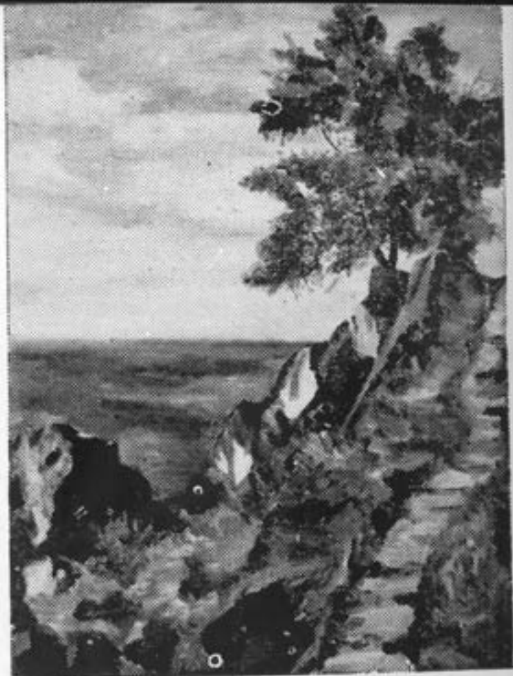
یسکی از مناظر اسپانیه