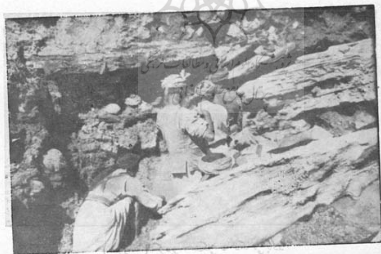
( میرز که ) گردیز ، اطافی که مسکوکات از آنجا کشف شده