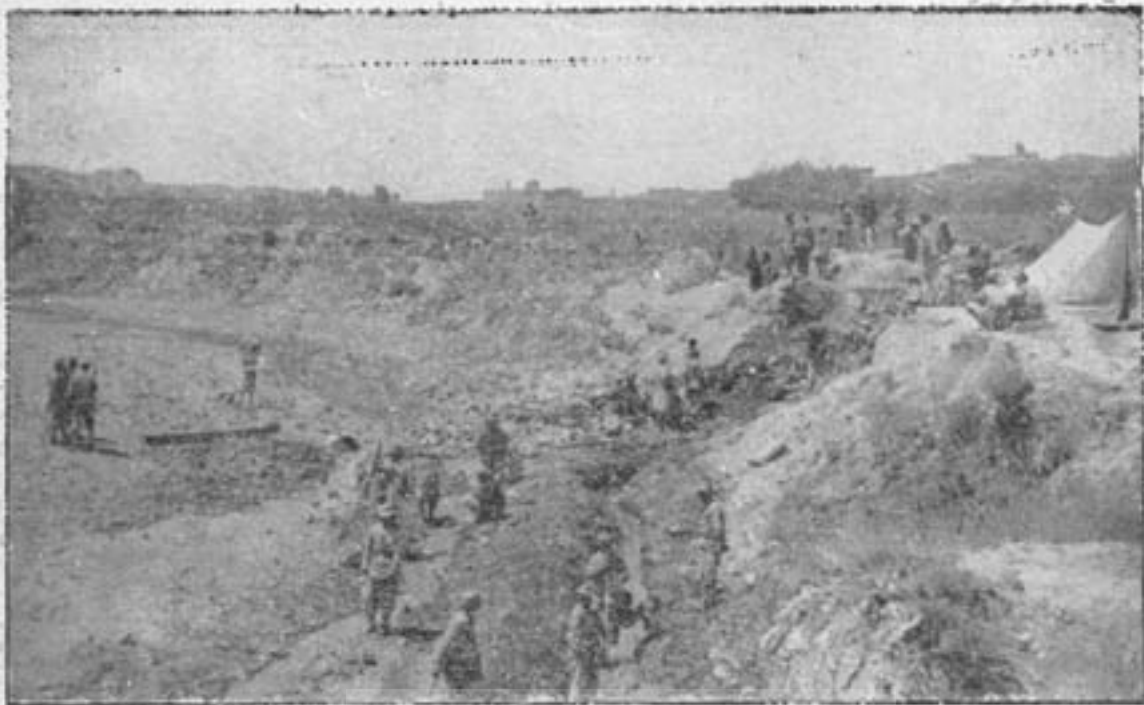
(میرز که) گردیز، مجرای رودخانه میرز که و چشمه نی که مسکوکات از آنجا کشف شده است.