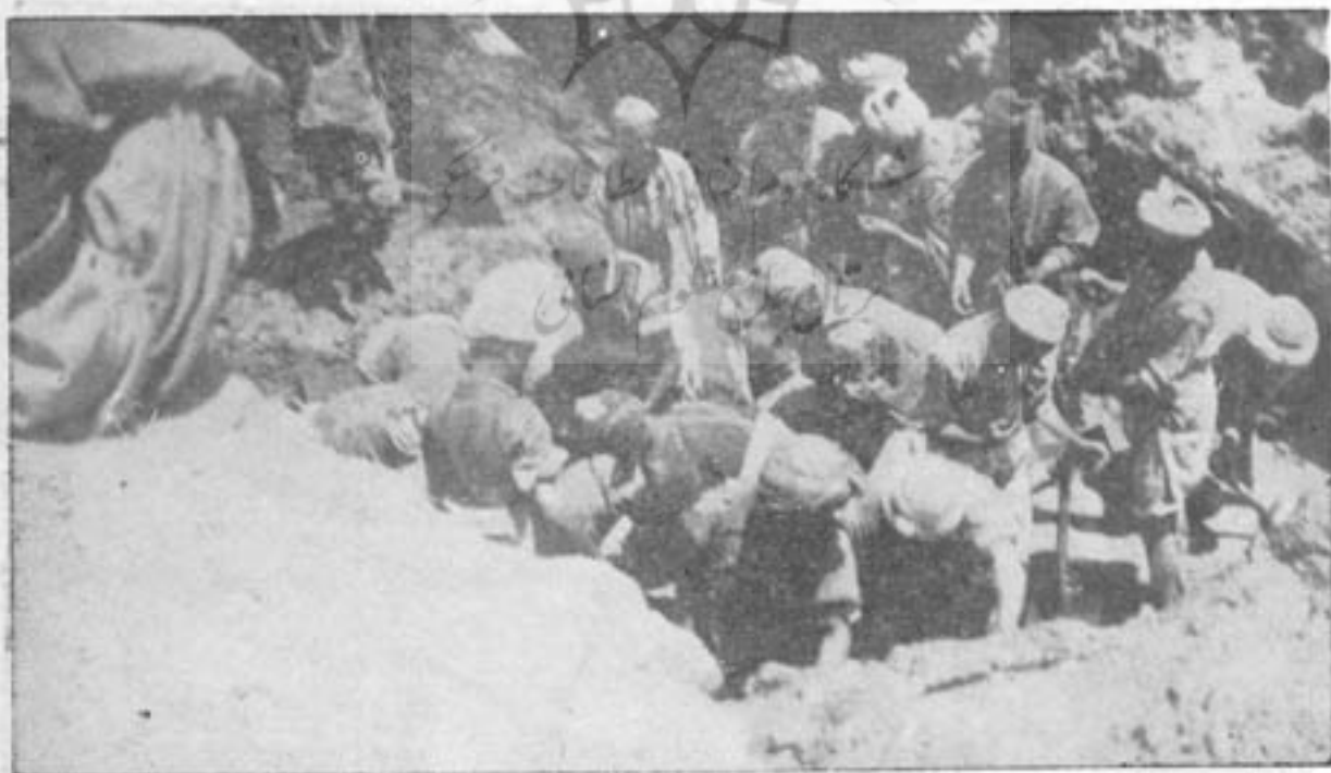
(میرز که) گردیز، مشکلی ها سکه می بالند

در زمانه امیر کبیر در سال ۱۲۸۵ قمری در این محل (میرز که)