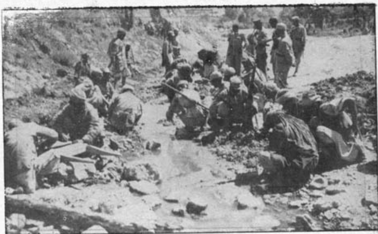
( میرز که ) گردیز ، کنایر مجرای آب چشمه اسپا هیان : مصروف پنا بدین مسکوکات میباشند