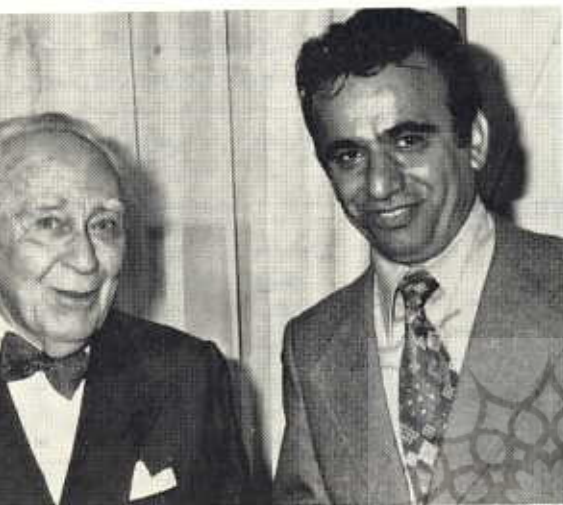
پروفیسور گریشمن و نگارندهٔ این مقاله .

بی روح را خواهند داشت که فقط از لحاظ زینتی مورد توجه هستند .