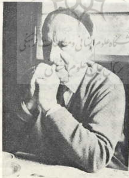
هایده‌گر در زمان ما

حاضر با بحران دموکراسی - پارلمان سیستم حکومتی روبرو هستیم. دیری است که ما گرفتار بحرانییم. خصوصاً در آلمان، اما نه فقط در آلمان. این بحران در کشورهای کلاسیک دموکراسی نیز وجود دارد: در انگلستان و آمریکا. در فرانسه که دیگر از حد بحران نیز گذشته است. و حال پرسش ما اینست: آیا از ناحیه متفکران به صورت فرعی هم که باشد نمی‌توان راه‌نمایی‌هایی گرفت دال بر این که سیستم دیگری باید جانشین سیستم‌های موجود گردد و این امر چگونه باید باشد، یا دال بر اینکه اصلاحات باید بتوانند ممکن باشند و این که اصلاحات چگونه می‌توانند ممکن باشند. در غیر این صورت آدم غیر فلسفی - و این آدم معمولاً همان کسی است که تمشیت امور را در چنگ دارد و خود در چنگ امور گرفتار است (اگرچه او نیست که امور را متقین می‌سازد) - به نتایج خطا می‌رسد و حتی شاید عواقب وخیمی بوجود می‌آورد. بنابراین آیا فیلسوف نباید بر این فکر بیفتد که آنها چگونه زیست با هم‌دیگر را در جهانی که خود در تکنیک مستحیل ساخته‌اند، در جهانی که آنها را در انقیاد خود گرفته است میسر سازند؟ آیا این توقع بجا نیست که فیلسوف بگوید وی چه تصویری از امکانات زندگی دارد و درست نیست که اگر فیلسوف هیچ اظهاری در این مورد نکند، در وجهی - هر قدر هم این وجه ناچیز باشد - از اشتغال و تکلیف خود قصور ورزیده است؟