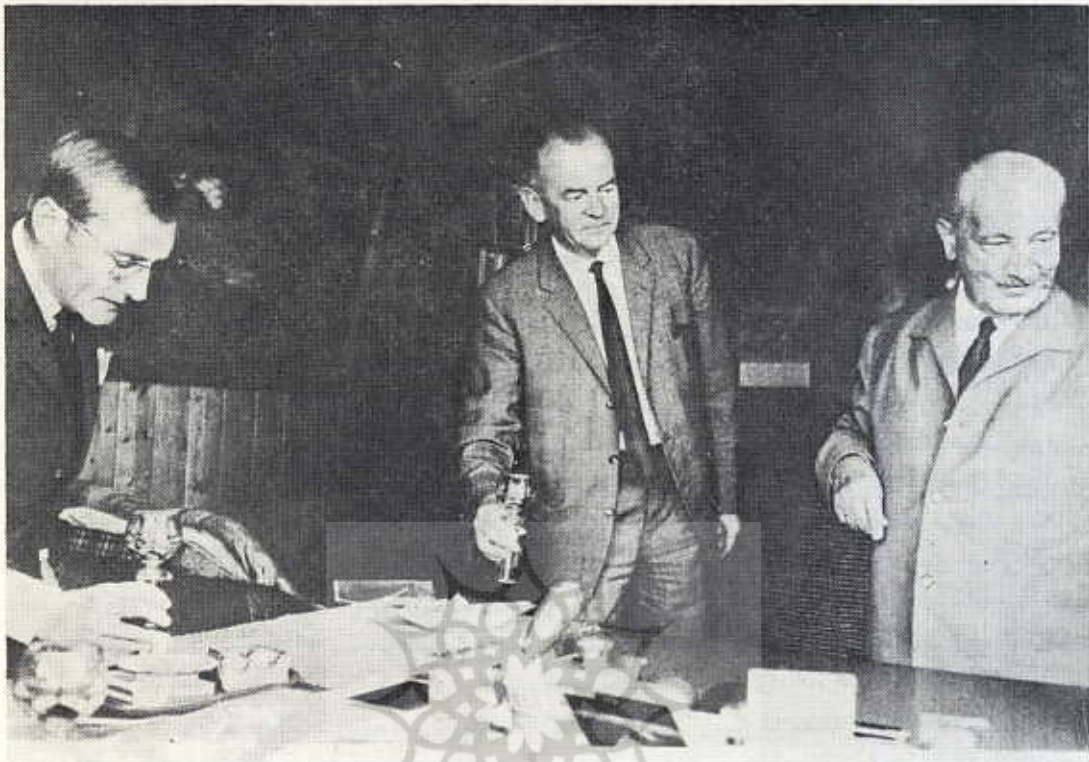
هایدگر با ردلف اوگشتاین و گئورگ ولف

به محل ریاست دانشگاه رفتیم و به همکاران حاضر «فن مولن دورف» و «زائر» اظهار کردیم که نمی‌توانیم ریاست دانشگاه را به عهده بگیریم. هر دو همکار در پاسخ گفتند: تدارک انتخابات به جایی رسیده است که من دیگر نمی‌توانم از نامزدی استعفا کنم.