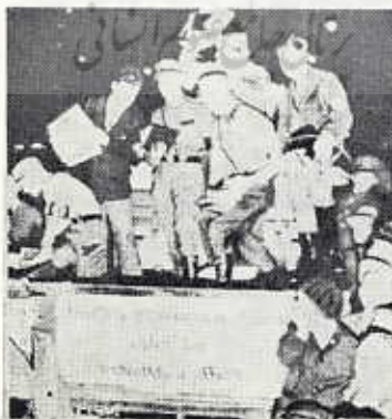
هایده گر در جمع نازیها

اشپیگل : ما ناچاریم - وهم اکنون به این نقل کلام خاتمه می دهیم - عبارت دیگری از شما نقل کنیم که به تصور ما شما امروز دیگر بر آن صحنه نمی گذارید . شما در پائیز ۱۹۳۳ گفته اید : «احکام علمی و ایده ها قواعد شما نیستند . شخص رهبر به تنهایی واقعیت امروزی و آنی آلمان و قانون آن است .»