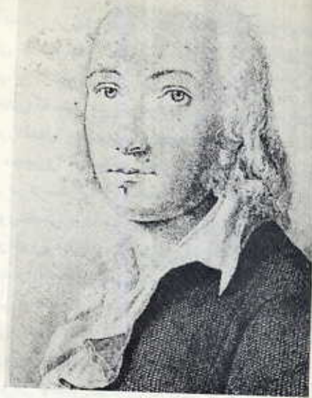
اشیگل: تصور ناراحت کننده‌ایست.

هایده‌گر: چه خوب بود ما این ناراحتی را کاملاً به جد می‌گرفتیم و به این توجه می‌نمودیم که تغییرات پرآسیبی بر تفکر یونان از طریق ترجمه آن به زبان لاتینی مترتب بوده‌اند، رویدادی که هنوز که هنوز است ما را از اندیشیدن گفته‌های اصلی تفکر یونانی باز می‌دارد.