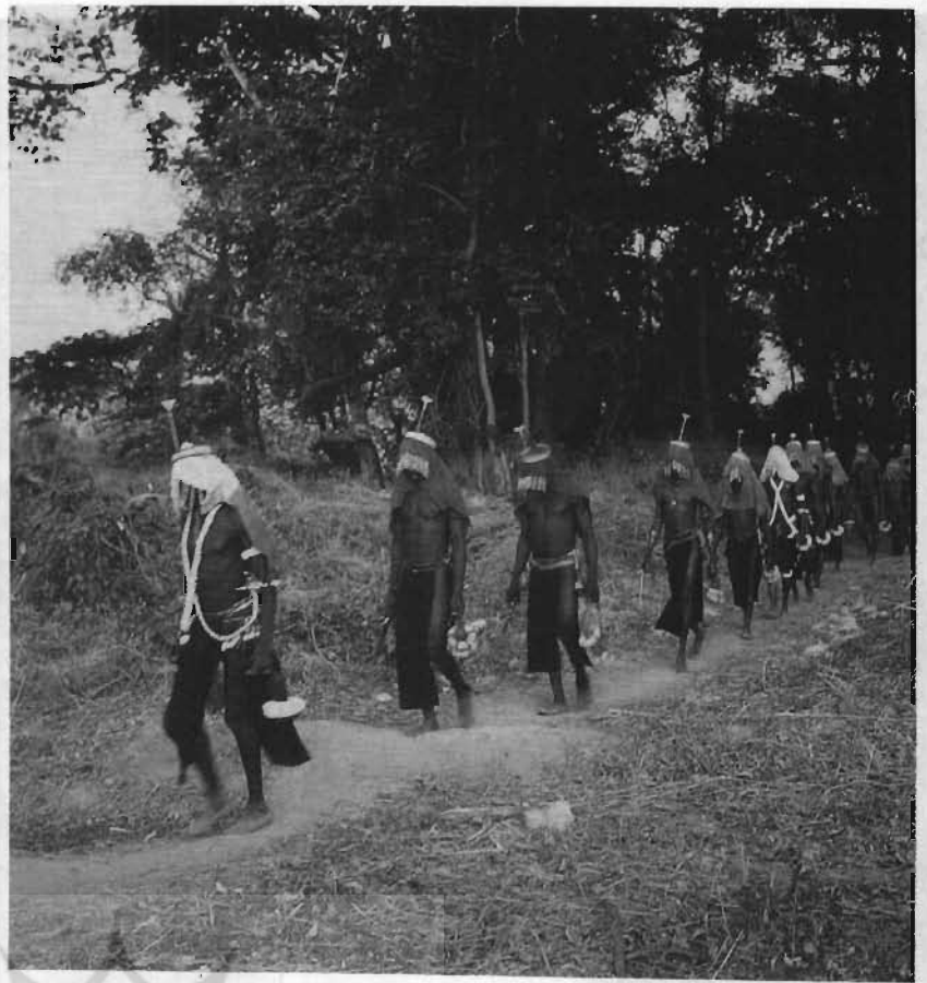
جوانان سنو، پس از انجام مراسم باگشایی ورود به زندگی بزرگسالی به دهکده خود برمیگردند (ساحل عاج).

صورت شعر ضبط شده و موسیقی روی آن گذاشته شده است. برای مثال، گریوهای کِلا، هر ساله به مدت یک ماه آن را در شبهای پنجشنبه تا جمعه و شنبه تا یکشنبه و یکشنبه تا دوشنبه، تماماً به مدت ۱۰۰ ساعت از حفظ نقل می‌کنند.