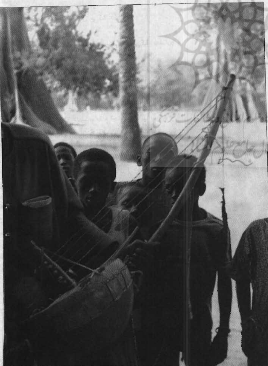
یک گریو در کارامانس (سنگال).

(Ocba Ben Nafi)، شخصیتی پیشرو در گسترش اسلام در مصر و شمال افریقا، رواج یافت. گفته اند که او پس از بنا نهادن پی های مسجد قیروان در تونس، نماینده ای به پایتخت واگادو (غنا امروزی) فرستاد تا از کایا ماغان (Kaya Maghan)، امپراتور آن دیار، بخواهد که به اسلام بگردد. این امپراتور پیشنهاد او را رد کرد، ولی به اتباعش، خصوصاً آنها که با ترکیه تجارت می کردند (تجارت الماس، خواجه و برده)، اجازه داد دین جدید را بپذیرند و اولین نوگرویدگان، مردم سونینکه بودند.