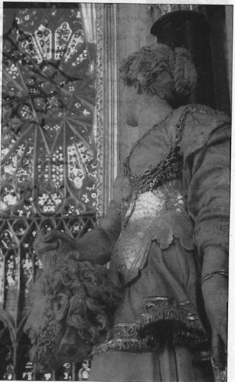
پیش‌زمینه، پیکره‌ای اثر یک هنرمند گمنام قرن شانزدهم، سالومه سر یحیی تعمیردهنده را در دست گرفته است.

کلیسای گوتیک اولیه آمین، در ۱۱۵۲ وقف گردید و در ۱۲۱۸ دچار آتش‌سوزی شد. کلیسای دیگری می‌بایست ساخته می‌شد. مردم آمین، مانند بسیاری از هم‌عصرانشان می‌خواستند بنای قبلی را ترمیم کنند و برای اینکار ثروت کافی در اختیار داشتند. شهر آمین رونق خود را مدیون بافندگان، ریسندگان و رنگرزی بود که با استفاده از گیاهان، رنگ «آبی» بسیار زیبای آنرا خلق کردند. انجمن کلیسا نیز به دلیل هجوم زائران توانمند شده بود. اسقف اورار دوفوی (Evrard de Fouilloy)، بی‌درنگ از معماری به نام روبر دو لوزارش (Luzarches)، تقاضا کرد تا کلیسایی به سبک گوتیک بسازد، سبکی که از قرن قبل پدید آمده و بعد رواج یافته بود — کار احداث کلیساهای شارتر، بورژ و پاریس قبلاً