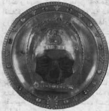
چهرهٔ يحيى تعمیددهنده. یادگاری از گنبد این کلیسا.

پناهگاههایی ساخته بودند تا در هوای نامساعد نیز کار ادامه پیدا کند و اجزای پیش‌ساخته‌ای را که بناها آماده کرده بودند، انبار می‌کردند تا با مساعد شدن هوا از آنها استفاده کنند. کار روی یک کلیسا، معمولاً از جایگاه همخوانان که مرکز عبادت است، آغاز می‌شود. ولی چون محل ساخت جایگاه همخوانان اشغال بود، کار ساختن کلیسای آمین از تالار اصلی شروع شد و بنا به شیوهٔ رایج آن زمان، پنجره‌های بلند را روی یک طاقنمای سه چشمه کور، قرار دادند. اما، پس از مرگ روبر دو لوزارش در حدود ۱۲۲۲، وقتی جایگاه همخوانان و بیرون‌نشستهٔ پس‌محراب را می‌افزودند، فنون ساختن سه چشمهٔ باز، بر همه شناخته شده بود. به همین دلیل در کلیسای آمین نور فراوانی به عقب ساختمان می‌تابد و به آن زیبایی خاصی می‌بخشد که هر بیننده‌ای، چه مسیحی و چه غیرمسیحی، به یکسان آن را احساس می‌کند. از قرن ۱۲، طراحان معماری گوتیک به‌خلاف بیشتر از پُری اهمیت