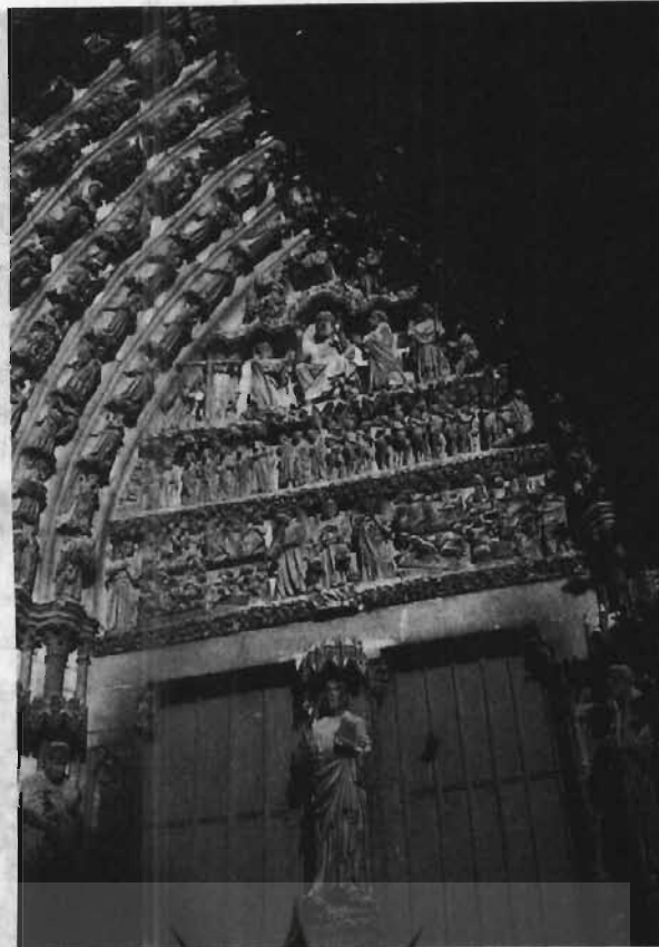
یکی از ورودیهای غربی که با پیکره‌های قرن ۱۳ از جمله «خدای زیبا» و «روز رستاخیز» تزئین شده است.

خیلی بالاتر، بر فراز «نگارستان شاهان»، که در تمام کلیساهای جامع گوتیک فرانسه دیده می‌شود، یک نورگیر خورشیدی خودنمایی می‌کند که تزئینات مشبک سنگ و شیشه آن به صورت دایره‌ای به قطر حدود ۱۳ متر گسترده است. این دایره بزرگ به وسعت میدان سیرکی است که برای دوازده اسب سرکش جا دارد. در