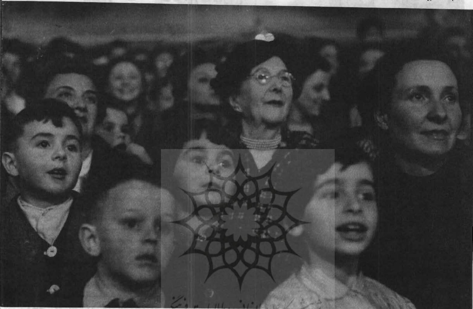
پربندهای مردم نشان و طاقالت فرنگی

جماعت حیرت زده در گران سیرک، پاله داسپور، ساریس، ۱۹۵۷