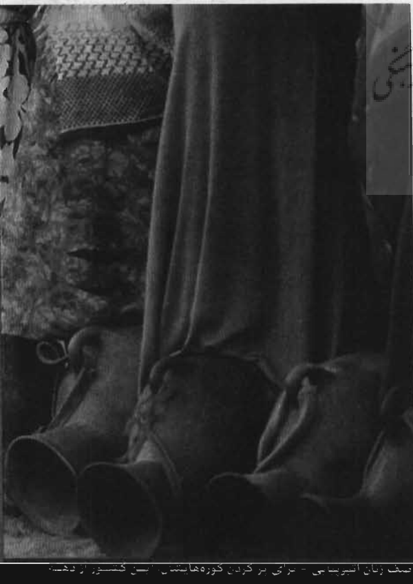
صف زنان اریترایی - برای بر کردن کوره‌هایش - این کشور اردن است.

موزس ایزیگاوا، نویسندهٔ اوگاندایی (۱۹۶۳)