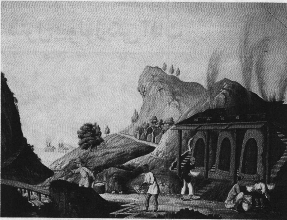
کوره‌های مرسوم برای پختن چینی (نقاشی اواخر قرن هجدهم).