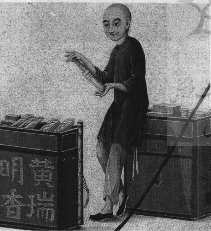
یک نقاشی اواخر قرن هجدهم از یک دستفروش چینی که کبریت می‌فروشد.