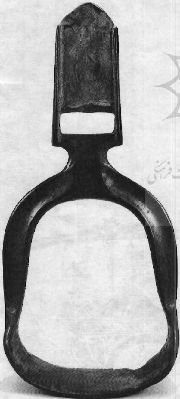
رکاب مفرغی مربوط به سده ششم یا هفتم میلادی

پژوهشگاه علوم انسانی و مطالعات فرهنگی پرتال جامع علوم انسانی