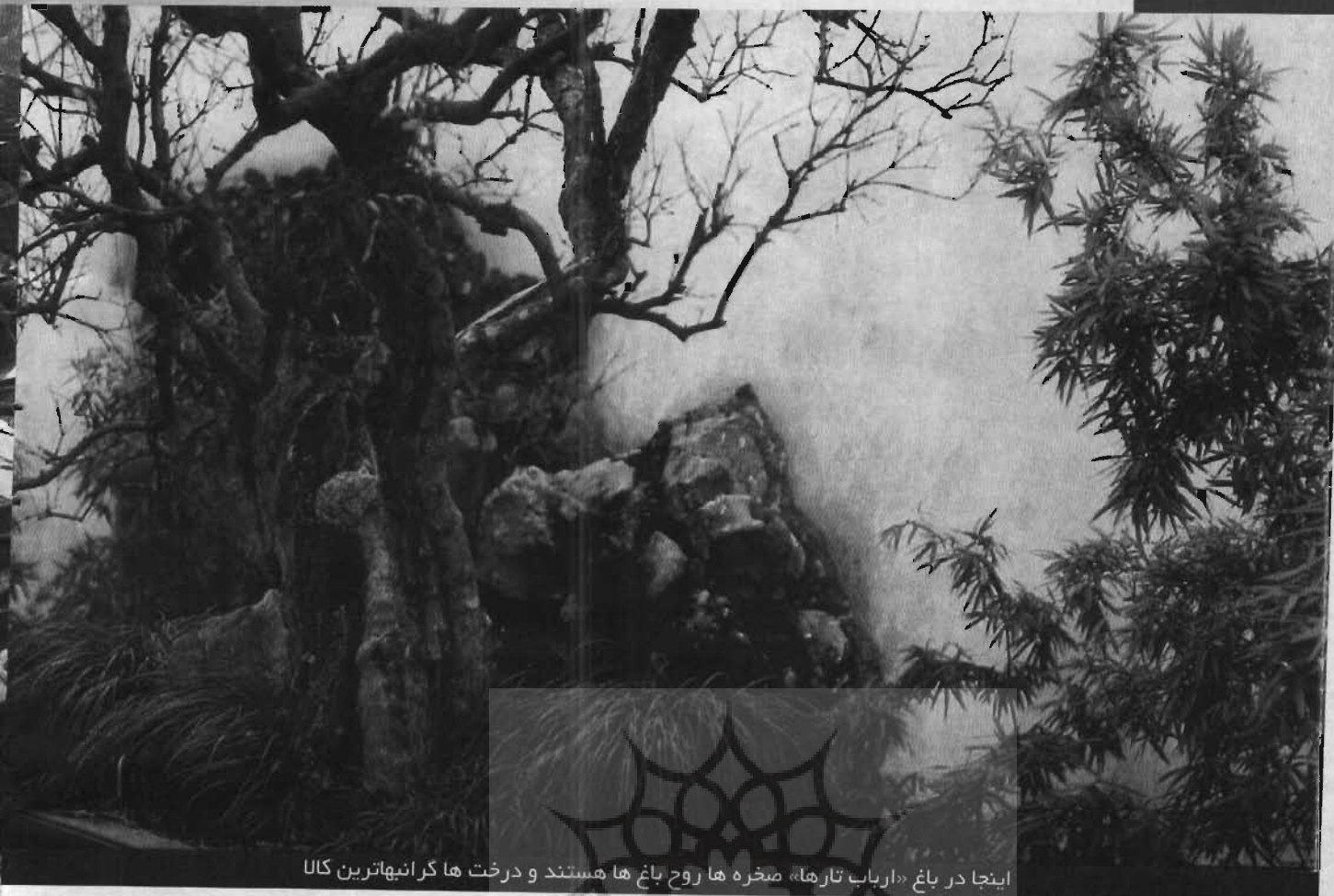
اینجا در باغ «ارباب تارها» صخره ها روح باغ ها هستند و درخت ها گرانبهاترین کالا