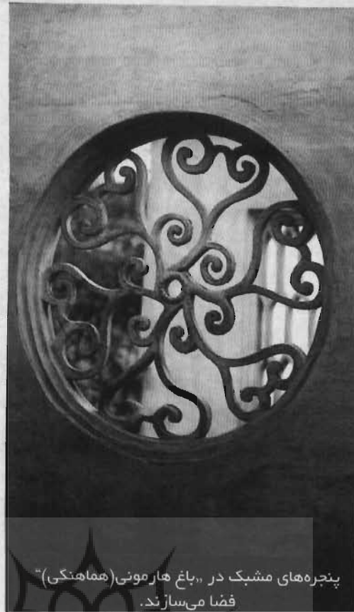
پنجره‌های مشبک در «باغ هارمونی» (همانگی) فضا می‌سازند.

امروز معماران محوطه‌ساز قبل از ساختن یک پارک یا زمین بازی نقشه‌ای ترسیم می‌کنند. استادکاران باغ‌های سوزهو، طرح ابتدایی نداشتند. شعر منبع الهام آنها بود و از نقاشان چینی الهام بسیار می‌گرفتند. در مقابل، نقاشان چینی نیز آثار آنان را می‌ستودند. بنابراین نقاشان، شاعران و خوشنویسان زیادی در خلق باغ‌های سوزهو نقش داشته‌اند. ساختن باغ‌ها هرگز تمام نمی‌شد. آنها به مرور زمان زیباتر، بزرگ‌تر و کامل‌تر می‌شدند. رسم بر این بود که وقتی باغ سنگی، رودخانه یا آلاچیق تمام می‌شد، استادکاران، دوستان ادیب خود را برای نوشیدن نوشابه‌های مشهور دعوت می‌کردند و به آنها فرصت می‌دادند تا آزادانه قوه تخیل خود را به کار اندازند. مهمانان روی سنگ‌ها خطاطی می‌کردند، جملات موازی (هم‌معنا) را به صورت عمودی می‌نوشتند! در مورد مکان ایجاد پل یا آلاچیق جدید نیز نظر می‌دادند، سپس استادکاران باغ را بر اساس توصیه آنها می‌آراستند و مجدداً از آنها برای صرف نوشیدنی و سرودن شعر دعوت می‌کردند. باغ‌های سوزهو، در صورت به‌کار بردن روشی دیگر در خلق آنها هرگز صفا و زیبایی - یعنی عامل شهرت‌شان - را کسب نمی‌کردند.