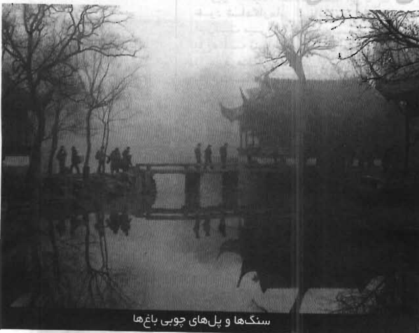
سنگ‌ها و پل‌های چوبی باغ‌ها

در سال ۱۹۲۸ در ایالت لیانگ‌شو متولد شد. از سال ۱۹۴۵ در سوزهو ساکن شد و به عنوان روزنامه نگار به رمان نویسی نیز پرداخت و موفق به کسب جوایز متعدد ادبی شد. وی معاون انجمن نویسندگان چین و بنیانگذار و سردبیر ماهنامه سوزهو است. کتاب‌های او از جمله «غذاشناس» و دیگر «داستان‌های چین مدرن» به زبان انگلیسی برگردانده شده است.