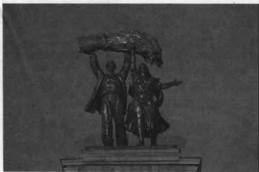
مجسمه یک زوج کارگر یک مزرعه اشتراکی. مجسمه خیلی بزرگتر از اندازه طبیعی است.

سمت راست خیابان گورکی، یکی از پررفت و آمدترین خیابانهای مسکو، مقر اداره تلگراف.