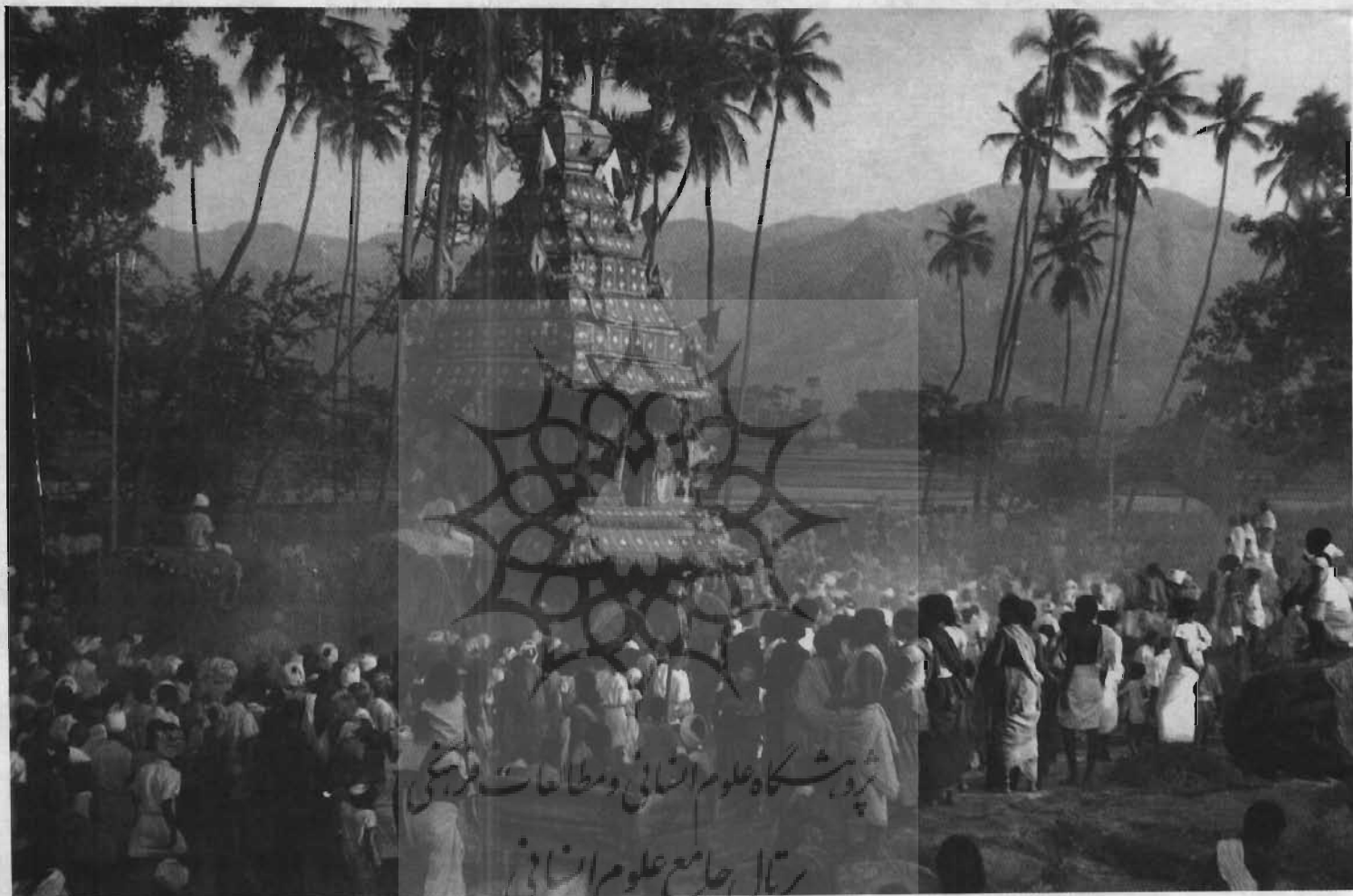
ارابه عبادت (راتا) در تامیل نادو، بخش جنوبی هند. این ارابه که به وسیله فیله‌ها و بهروان حمل می‌شود، چندین تن وزن دارد.

به‌ناگه و یا به‌مار و غیره. شروع هر فصل نیز گرمی داشته می‌شود و هر فصلی جشن خاص خود را دارد: جشن وزانت پانجمی در بهار (اوائل فوریه)، و بعد در شبی از شبهای پاییز، اواخر اکتبر، در زیباترین مهتاب جشن شارادپورنیمما برپا می‌شود. محل جشن و سرورها در کناره رودخانه‌های مقدس است. جشن کومبا هر دوازده سال یکبار و در ماه ماگه (ژانویه - فوریه) در التقای رود گنگ و یا مونا در الله‌آباد برپا می‌شود. در این روز قریب پنج میلیون زائر از سراسر هند گرد می‌آیند تا در این ماه نو (آماوازیا) تنشان را با آب مقدس این رودها تطهیر کنند. جشن مذهبی (اسلامی) عید فطر در پایان ماه