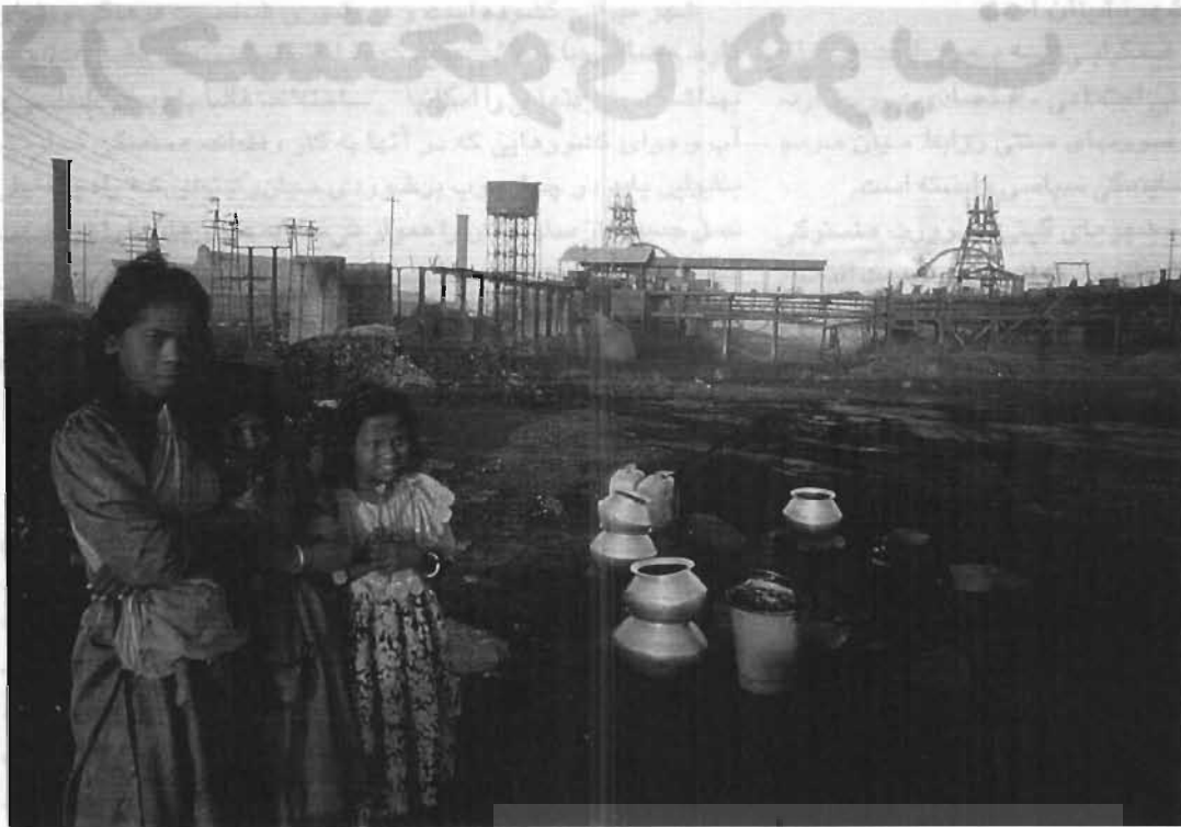
«در نگرش اقتصادی توسعه، ارزشها و فرهنگ نقش مهمی ندارند». بالا، مرکز معدنکاوای چارنیا (هند).

فقر حقیقی فقط به معنای محرومیت مادی نیست بلکه همچنین به معنای نبود امکانهای واقعی انتخاب شیوه‌های دیگر زندگی در نتیجه تنگنایهای اجتماعی یا شرایط شخصی است.