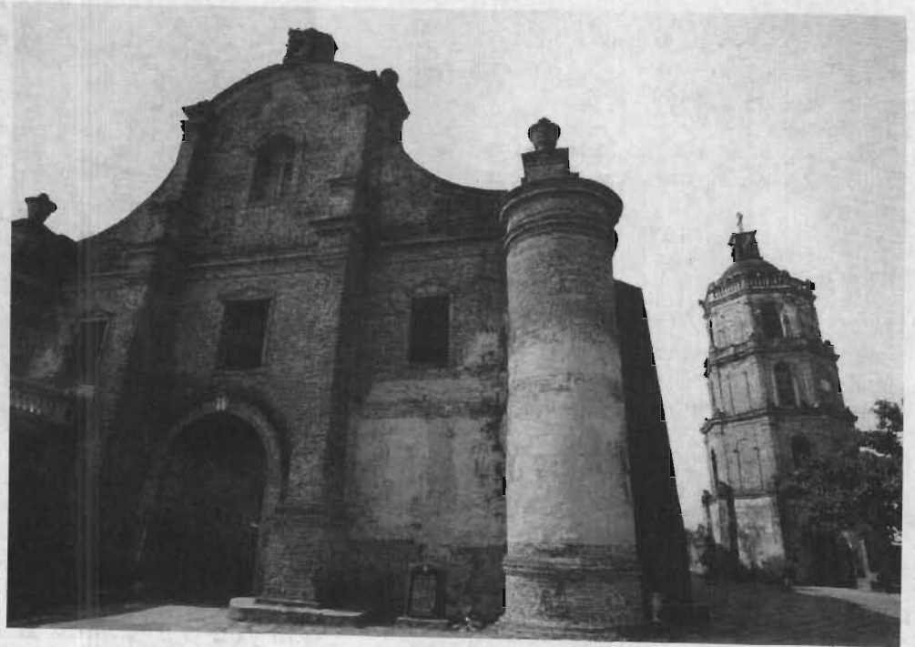
کلیسای نوتردام دو آسانسیون در سانتاماریا (استان ایلوکوس جنوبی) و برج ناقوش.