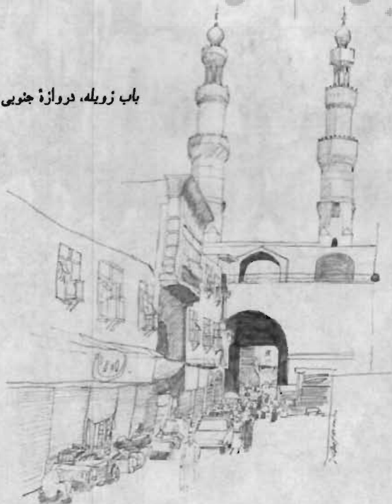
باب زویله، دروازه جنوبی شهر فاطمیان (منطقه چهارم)

این مقاله از گزارشی به عنوان (نگهداری شهر کهنه قاهره) که هیئت اعزامی یونسکو به قاهره آماده کرده، اقتباس شده است. نقشه‌های توضیحی متن این مقاله در کتاب «تعمیر و مرمت بناهای تاریخی» به قلم نویسندگان شهرهای اسلامی و حمایت آنها، از انتشارات یونسکو در ۱۹۸۲، نیز هست.