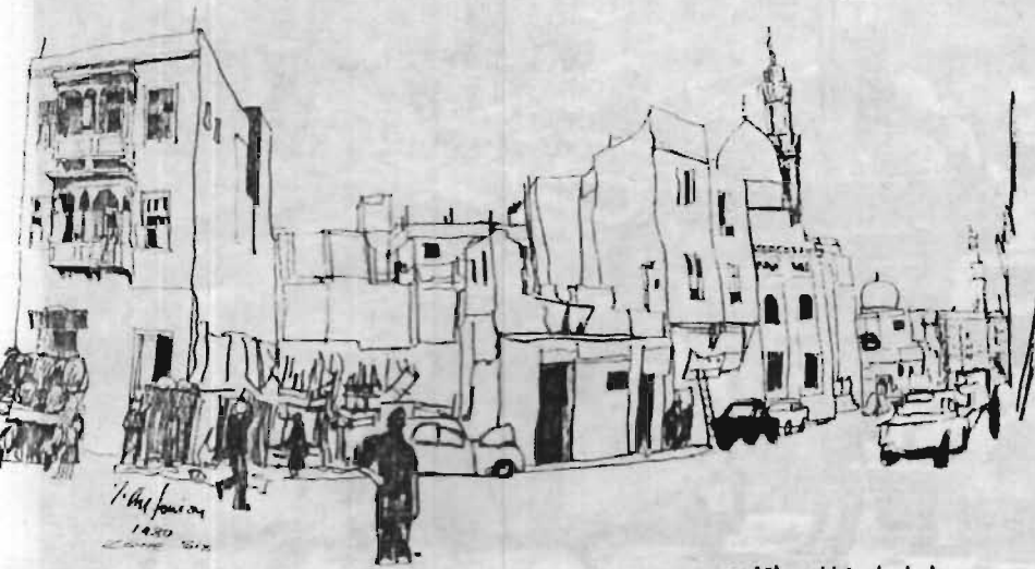
منظره‌ای از خیابان منطقه ششم

در سال ۱۹۷۹ نام شهر کهنه قاهره به موجب «موافقنامه یونسکو» برای حفظ میراث فرهنگی و طبیعی جهانی به ثبت رسید و اهمیت همگانی بخشهای تاریخی این شهر را به تأیید رسانید. با این حال، نگاهداری ششصد بنای تاریخی در شهری که همواره در حال گسترش است و انتظار می‌رود با فرارسیدن سال ۲۰۰۰ تعداد ساکنانش از ۱۲ میلیون به رقمی بین ۱۶ تا ۲۰ میلیون برسد، مسئله‌ای بس مشکل را مطرح می‌سازد. یونسکو در فوریه ۱۹۸۰، بنا به درخواست دولت مصر، تعهد کرد هیتی را به مصر اعزام کند تا گزارشی استراتژیک درباره نگهداری شهر کهنه قاهره تهیه کنند. اعضای این هیئت در فاصله فوریه تا اوت ۱۹۸۰ بازدیدهایی چند به عمل آوردند.