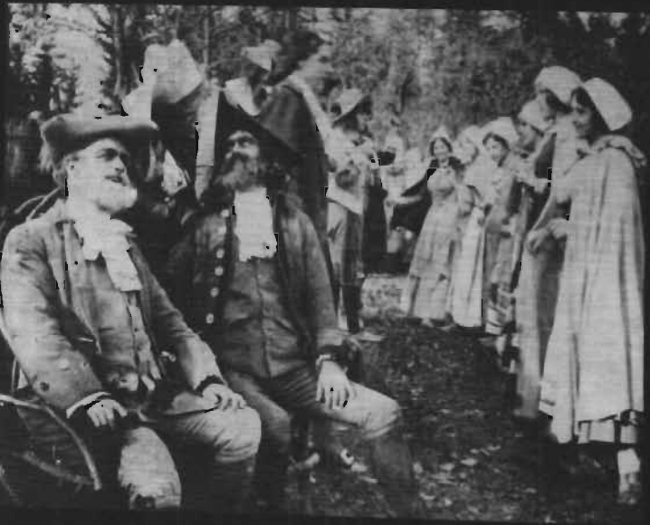
«اوانگلیس»، محصول سال ۱۹۱۳ کانادا به کارگردانی ا. پ. - سالیوان و و. ه. - کاونو که احتمالاً نخستین فیلم سینمایی دراماتیک است که در آمریکای شمالی تهیه شده است. این فیلم درباره اخراج آکادیها از اسکاتلند جدید است که در سال ۱۷۵۵ توسط دولت انگلیس صورت گرفت.