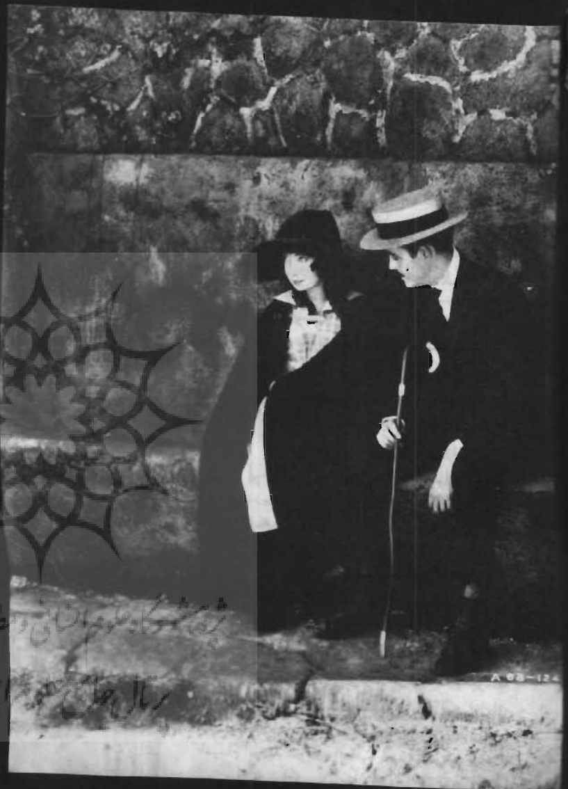
«بزرگترین موهبت زندگی»، محصول سال ۱۹۱۸ آمریکا به کارگردانی د. و. - گریفیث. هر یک از فیلم‌های گریفیث را می‌توان حلقه‌ای حیاتی از زنجیره تحول تکنیک سینما دانست. لبیان گیش که (تصویر بالا) نقش اصلی فیلم را در مابیل راپرت هارون به‌عهده دارد آن را یکی از بهترین آثار گریفیث معرفی می‌کند.