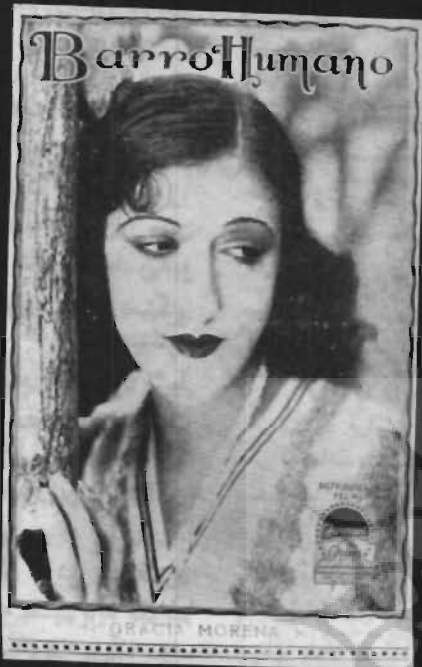
«بارو هومانو»، محصول سال ۱۹۲۹ برزیل به کارگردانی آدمنار گوتزاکا. این درام اجتماعی در زمان تحول سینمای برزیل تهیه شده و چون زندگی آن زمان را تصویر می‌کند بعنوان سندی فرهنگی و تاریخی به‌شمار می‌آید. عکس فوق چهره گراسیا مورنا، ستاره فیلم را نشان می‌دهد.