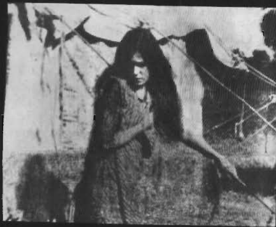
«عالم آرا»، محصول سال ۱۹۳۱ هندی به کارگردانی اردشیر ایرانی، نخستین فیلم ناطق و درام عشقی موزیکالی که درباره زندگی سلطان کومار - پور و دو ملکه اش نوشته شده بود.