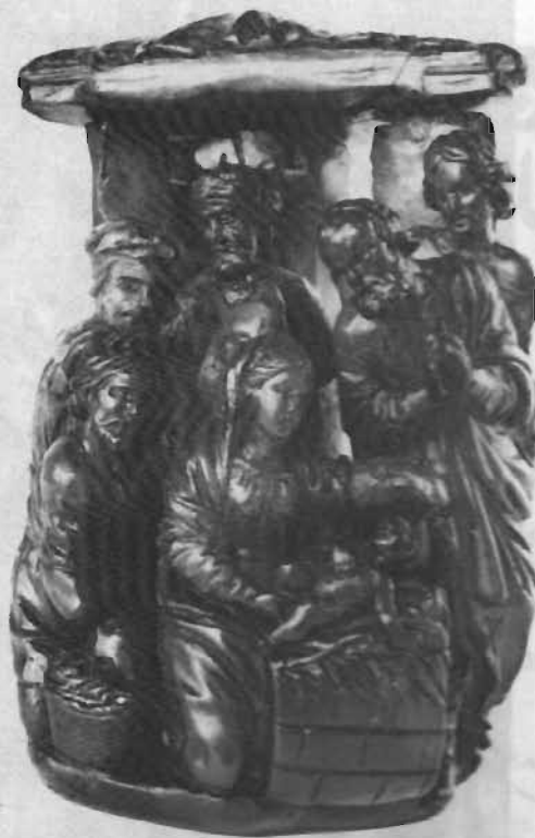
میناتور از جنس کهربا (به ارتفاع سه سانتی) که تصویر کننده کاری شده بسیار ظریف از جوانان را در حال کرتش به تیمای کودک نشان می‌دهد. عقیده بر این است که این اثر در حدود سال ۱۶۵۰ در شمال شرقی آلمان ساخته شده است.