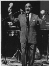
بالا: طبل تواز کوبایی، مونتگوسانتاماریا، چب، خواننده و رهبر ارکستر کوبایی مایخیزو در پاریس (۱۹۷۵).