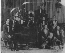
نخستین روزهای کاتن کلاب در نیویورک (۱۹۴۷). دوک الینگتون پشت پیانو در طرف چپ

کوبایی که نام واقعیش فرانک کریلو و فرادزین بوزا بود به ارکستر وی پیوست و تنظیم کننده آهنگهای کاتووی نیز جمع آسان را تکمیل کرد. در اوائل کار، آهنگهای این ارکستر خشک و خشن بود. نوازندگان کوبایی، پورتوریکویی و یک ترومپت نواز آمریکایی از اعضای این ارکستر بودند و همه آنها با هم در پایان همسرایی‌ها یک هریفه تند را می‌نواختند. ترومپت نواز گاهی در اجرای ریتمهای کوبایی دچار لغزش می‌شد و اعضای لاسین ارکستر در اجرای هارمونیهای پیچیده‌ی جاز درمی‌ماندند. اما بوزا به تدریج توانست این دو زبان موسیقی را باهم بیامیزد و سازهای گوناگون و نوا آنها را به صورت کبلی یکپارچه‌ای در آورد. ارکستر آفسرو - کسوپاتز در سال ۱۹۴۰ کار خود را در کنویتی در هارلم شرقی آغاز کرده و موسیقی نو و جسورانه آن به زودی با اقبال و فست‌تگانه رویداد شد. برای طبل نوازان آمریکایی که پیش از آن نسله‌ن طبل را سادست نسیده بودند یونگو سازی تازه، بود.