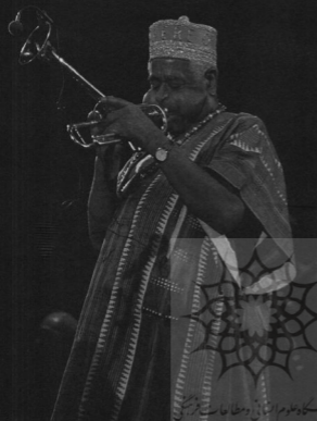
کادو مور اسپانی و مطاطات شرقی

در آغاز دهه پنجاه می‌رفت که اقبال عام از جاز کوبایی فروکش کند. اما دیزی گیلیسپی در دهه بعد با استفاده از موسیقی برزیلی جان تازه‌ای در کالبد جاز لاتین دمید. این موسیقیدان در سفری به ریو با نواهای سردمی «سامبا» و «بوساتوا» آشنا شد و