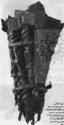
بالا: بول مازنیانی که از طناب لینی که با بره‌های قرمز و قطعات صدف تزیین شده ساخته شده است. سمت چپ: یک دسته میخ آهنین بزرگ که در کنگر به‌توان بول از آن استفاده می‌شد (اواخر قرن نهم).

بدین ترتیب بول نیز همانند رواسطی که در نظام سلسله مراتبی و سلطه‌گرایی برقرار است، ابداع جدیدی نیست و یکی از ویژگی‌های تمدن‌هایی است. باستانی‌تر از تمدن‌های حوزه مدیترانه، خاور نزدیک یا خاور دور و یا آمریکای مرکزی بوده است. گردش اشیاء گران‌بها در درون و با بین این جوامع امری همگانی و به نحوی حاکمی از عملکرد بول بعنوان وسیله مبادله و همچنین واحد شمارش بوده است. اما در این جوامع کهن این وظایف بنیادی هنوز کاملاً شکل اقتصادی به خود نگرفته بودند. این وظایف در واقع تجلی نظام‌های خوشایند، اتحادهای سیاسی و اعتقادات و مکاتب فکری بودند که بر عرضه نیروی کار مؤثر بوده، تولید را سازمان داده و تقسیم ثروت را توجیه می‌کردند.