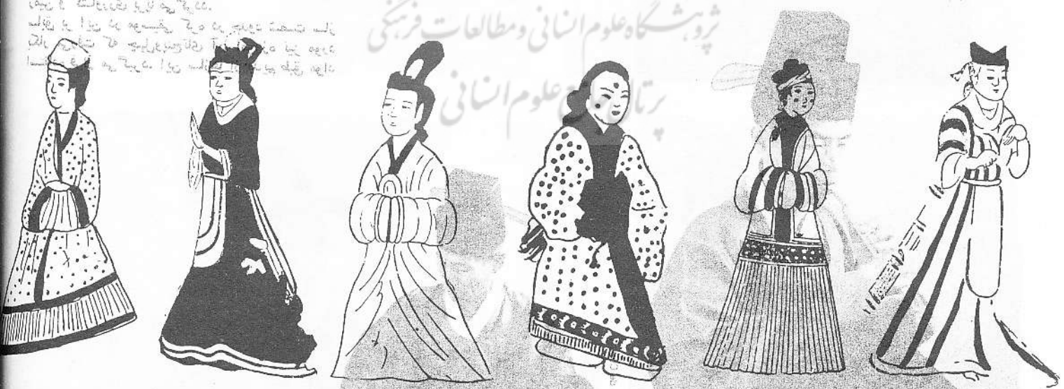
Académie des Sciences Sociales de la République Populaire Démocratique de Corée

نقاشی دیواری در مقابر کورئو، که در قرن اول میلادی است، نشانگر زندگی روزمره مردم آن زمان است. این نقاشی‌ها در مقابر کورئو و جیا، که در نزدیکی پکن واقع شده است، کشف شدند. این نقاشی‌ها به ما کمک می‌کند تا زندگی روزمره مردم کورئو در آن زمان را بهتر بشناسیم. در این نقاشی، یک مرد با لباس‌های فاخر و یک کلاه بلند، در یک اتاق ایستاده است. او به نظر می‌رسد که در حال مطالعه یا نوشتن است. این نقاشی‌ها به ما کمک می‌کند تا زندگی روزمره مردم کورئو در آن زمان را بهتر بشناسیم.