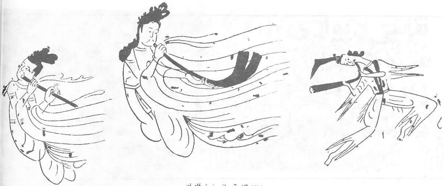
نوازندگان آسمانی مقبره رقااصان