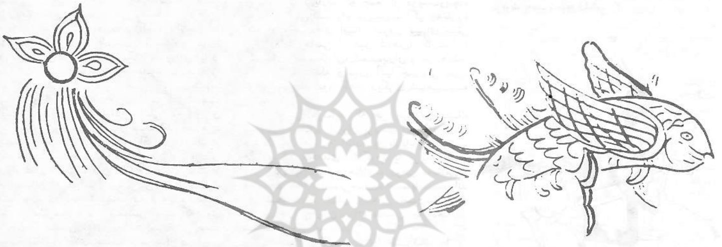
طرحی از نقاشیهای دیواری که در یکی از مقابر واقع در گورستان زیرزمینی کانتسو به عنوان تزئین بکار رفته است.