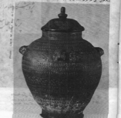
نام آن از نام یکی از شخصیهایی آسترومان فرانسوی قرن هفدهم میلادی گرفته شده است.

شوکت یانگ - مو Chong Yong - mo سیدی جزیره ملو کره را در شهر سئول به‌عنوان اداره او مشخص می‌کند که در کره‌یی است و این شهر را عرضه کرده و اصلی نوشته‌های خود فرار داده است.