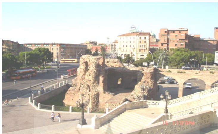
ماخذ: نویسنده، تاریخ عکس برداری، شهریور ۱۳۸۴