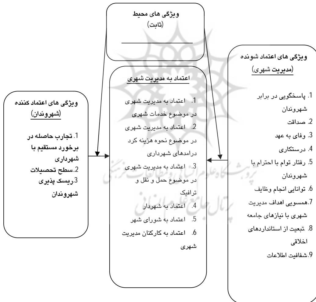
شکل (1): مدل پالایش شده عوامل اعتماد شهروندان نسبت به مدیریت شهری [5]

اعتماد، تکنیکی است که تمامی افراد آن را در روابط خود با دیگران به کار می گیرند، اما تا کنون بدان به عنوان تکنیک رفتاری که می شود آموزش داد و در جایگاه‌های مختلف از آن بهره گرفت نگریسته نشده است. [1] با توجه به دیدگاه‌ها و حوزه‌های کاری مختلف پژوهش‌گران، مدل‌های مختلفی در رابطه با اعتماد ارائه گردیده است. این مدل‌ها در حوزه‌های (1) اعتماد عمومی، (2) اعتماد در سازمان‌ها، (3) اعتماد در گروه و (4) اعتماد بین شخصی ارائه گردیده است. در این رابطه می توان به مدل اعتماد مایر [20]، مدل سایبرنتیک اولیور [23]، مدل فرایند ایجاد اعتماد احمدی مهربان [1]، مدل مقایسه‌ای گیدنز [11]، مدل مفهومی اعتماد عمومی کیم [14]، مدل پنج بعدی اعتماد شیندلر [27] و مدل اعتماد بین شخصی نیهان [۲۲]، مدل سه قسمتی پاور [24] مدل سه بعدی خودیاکف [13] اشاره نمود. این تحقیق بر اساس مدل مفهومی تعدیل شده اعتماد شهروندان نسبت به مدیریت شهری عابدی [5] صورت گرفته است.