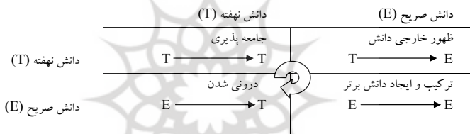
شکل ۱: مدل چهار مرحله‌ای خلق دانش

جلسات بیان افکار و اندیشه‌ها، تدابیری ساده برای ایجاد تعامل و برقراری ارتباط ذهنی باشند»، اما به نظر برن اشتاین ۱ برای درک و شناخت واقعی، باید به دنبال مفاهیم و هم‌ذهنی بود (Bernshitin 1976). گفتمان عملی فرصتی فراهم می‌آورد تا طرفین ذهن خود را نزد یکدیگر بگشایند و با اعتماد به هم، آنچه را در ذهن دارند، برای هم آشکار کنند. وجود اعتماد، هم‌هدفی و تمایل درونی، لازمی تحقق گفتمان است.