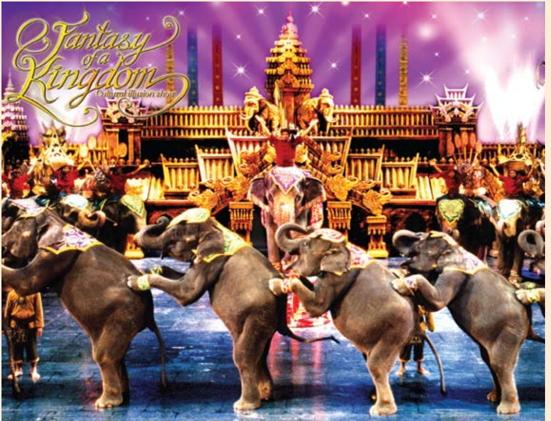
پوکت فانتازیا، یکی از تالارهای باشکوه در جزیره پوکت است که در آن با نمایش های موزیکال فرهنگ و تاریخ تایلند بازگو می شود

زندگی می کردند. به نظر می رسید این کلبه از میهمانان به طور محدود هم پذیرایی می کند. در این کلبه دورافتاده سه سطل زباله با سه رنگ مختلف چیده شده بود که نشان می داد آموزش بومیان برای تفکیک زباله ها تا چه اندازه در دورترین نقاط تایلند تاثیرگذار بوده است.