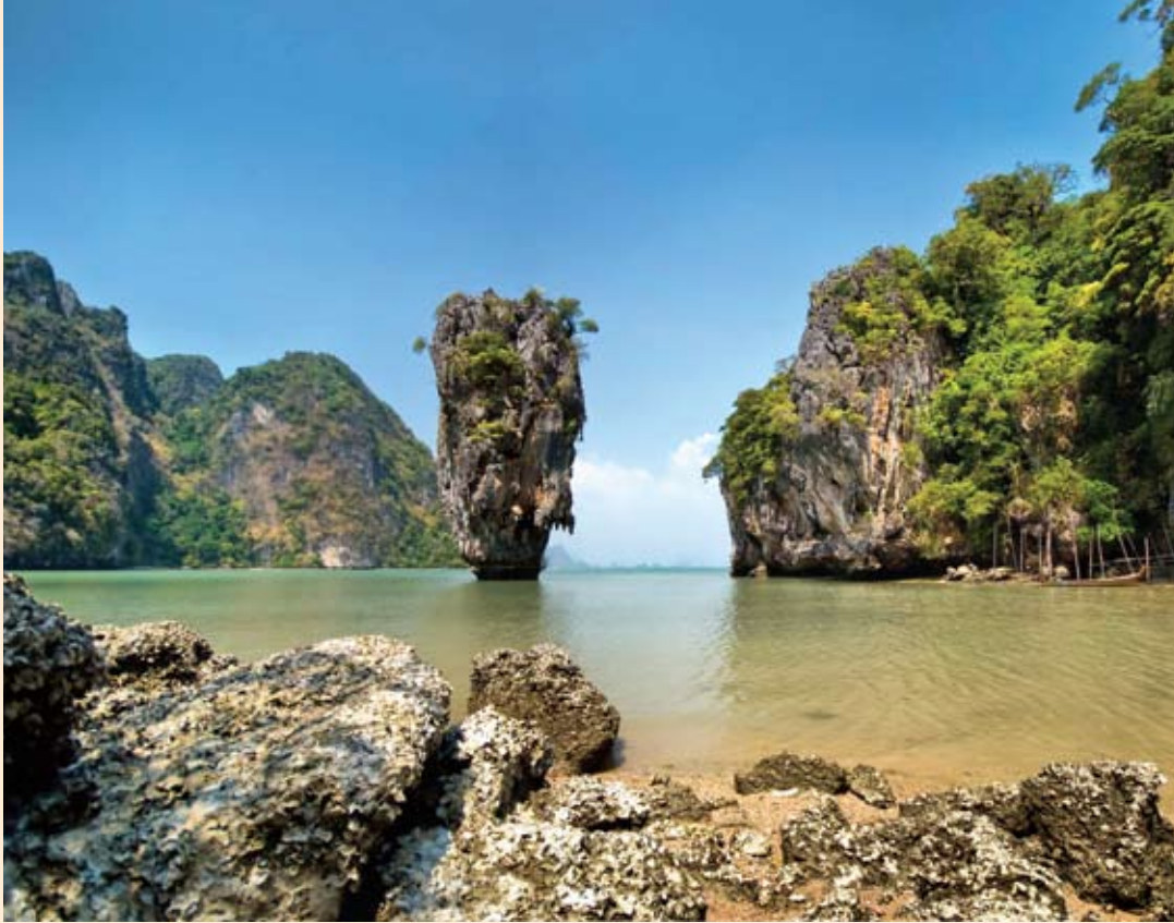
جزیره جیمزباند در پوکت. ساخت فیلم مردی با تپانچه طلایی از سری فیلم های جیمزباند در این منطقه بهانه ای است تا گردشگران به این جزیره که صخره های کله قندی دارند بیایند.

بیش از هر زمانی خوش می گذرد. به اندازه ای سرگرمی برای بچه ها مهیاست که هیچ گاه احتیاجی پیدا نخواهند کرد از هتل خارج شوند.