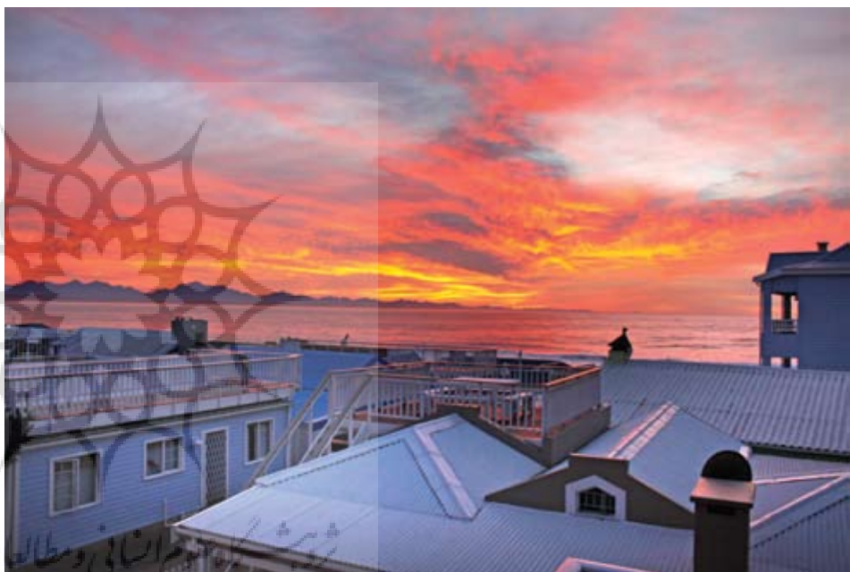
بالا: هتل در خلیج ماسل پایین: طلوع آفتاب خلیج ماسل

آفریقای جنوبی اما آماده‌ترین تکه پازل قاره سیاه برای جهش و رشد اقتصادی و پذیرش گردشگر است. به نسبت همسایگان زیرساخت‌های قوی‌تری دارد. همجواری با دو اقیانوس اطلس و هند خاستگاه تاریخی اروپاییان برای گذر به شبه قاره هند بوده است. با میزبانی جام جهانی ۲۰۱۰ به یکبارہ آفریقای جنوبی در کانون توجه جهان قرار گرفت و پرده از زیبایی‌های فروخته و شگفت‌انگیز این تکه از کره زمین کنار رفت.