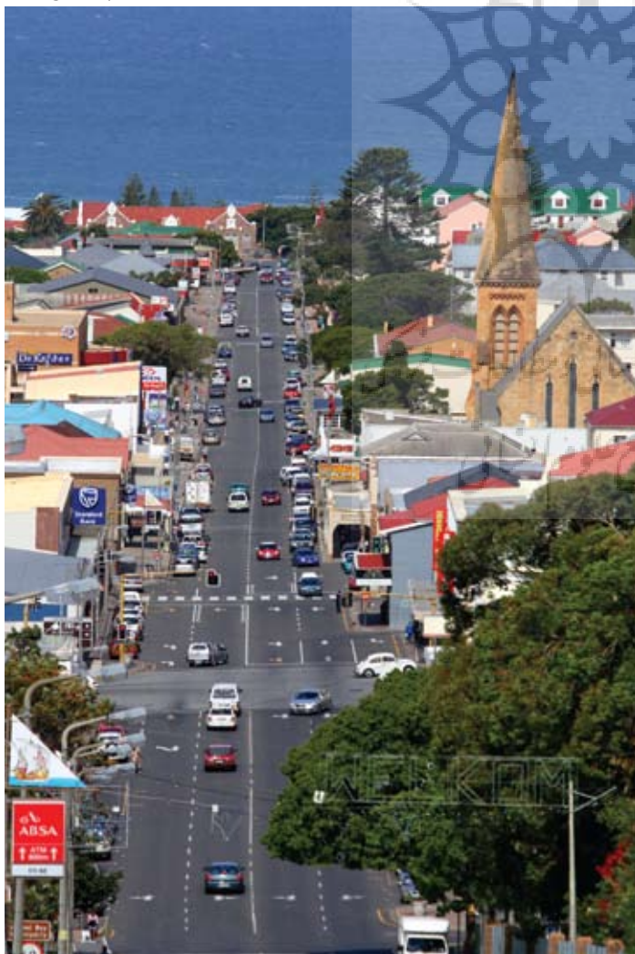
نمایی از زندگی و تردد آرام در خلیج ماسل

می‌شدند که در دریانوردی آن زمان رویداد عجیبی نبود. حالا در فضایی زیبا کشتی دیاس را بازسازی کرده‌اند و در موزه‌ای به همین نام در معرض دید گردشگران قرار داده‌اند. این موزه حاوی تصاویر و اشیای قدیمی دریایی هم هست که تاریخ دریانوردی کهن را بازگو می‌کند. نقاشی‌ها و یادگارهای هندوستان قدیم را می‌توان در این موزه دید. خلیج ماسل یکی از باثبات‌ترین آب و هواها را دارد. ۳۰۰ روز سال آفتابی است و خانه‌های زیبایی مشرف به دریا و ساحل ساخته شده‌اند. نوع شهر و زندگی مردم نشان می‌دهد که این خلیج سال‌هاست به همین شکل باقی و دست‌نخورده مانده است. مهم‌تر آن است که برای کسانی که ارزان سفر می‌کنند یک بهشت رویایی است. با قیمتی ناچیز می‌توانند اتاق‌های زیبا برای خود دست و پا کنند و روزها از تنوع گردشگری در این مکان لذت ببرند.