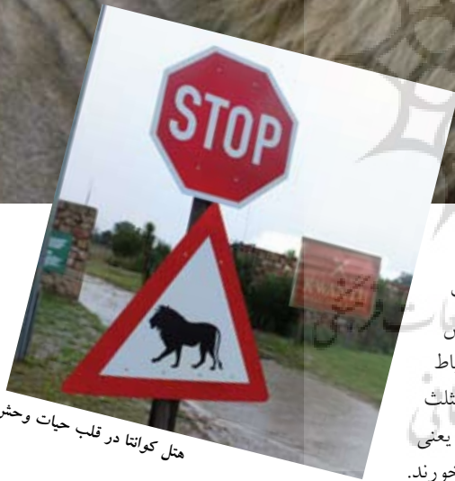
هتل کوانتا در قلب حیات وحش

را در خود نگاه دارد. از پشت خودرو تابلوی کوانتا مشخص شد و در کنار آن تابلوی احتیاط که تصویر شیری در وسط مثلث قرمز رنگ نقش بسته بود. یعنی مراقب باشید شیرها شما را نخورند. برای تازه واردان قدری شوک برانگیز