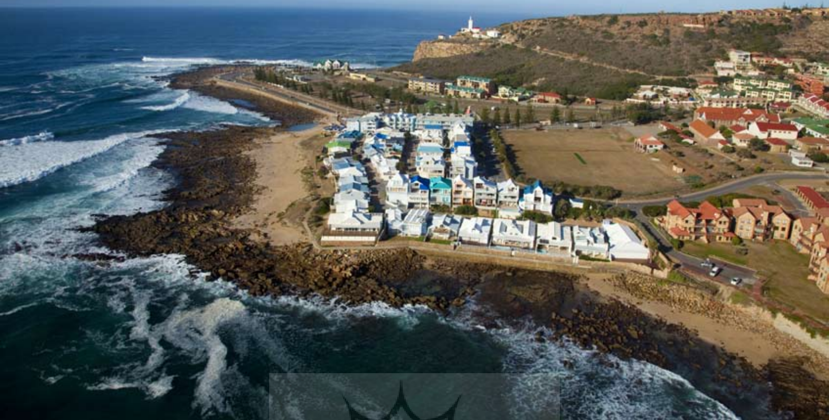
چشم انداز هوایی خلیج ماسل