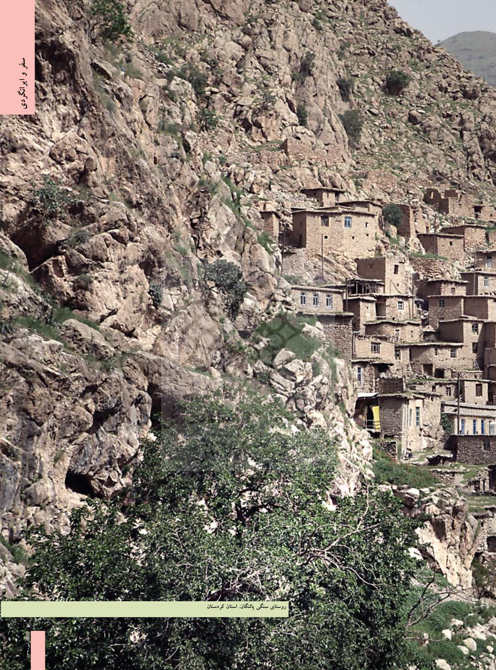
روستای سنگی پالنگان. استان کردستان