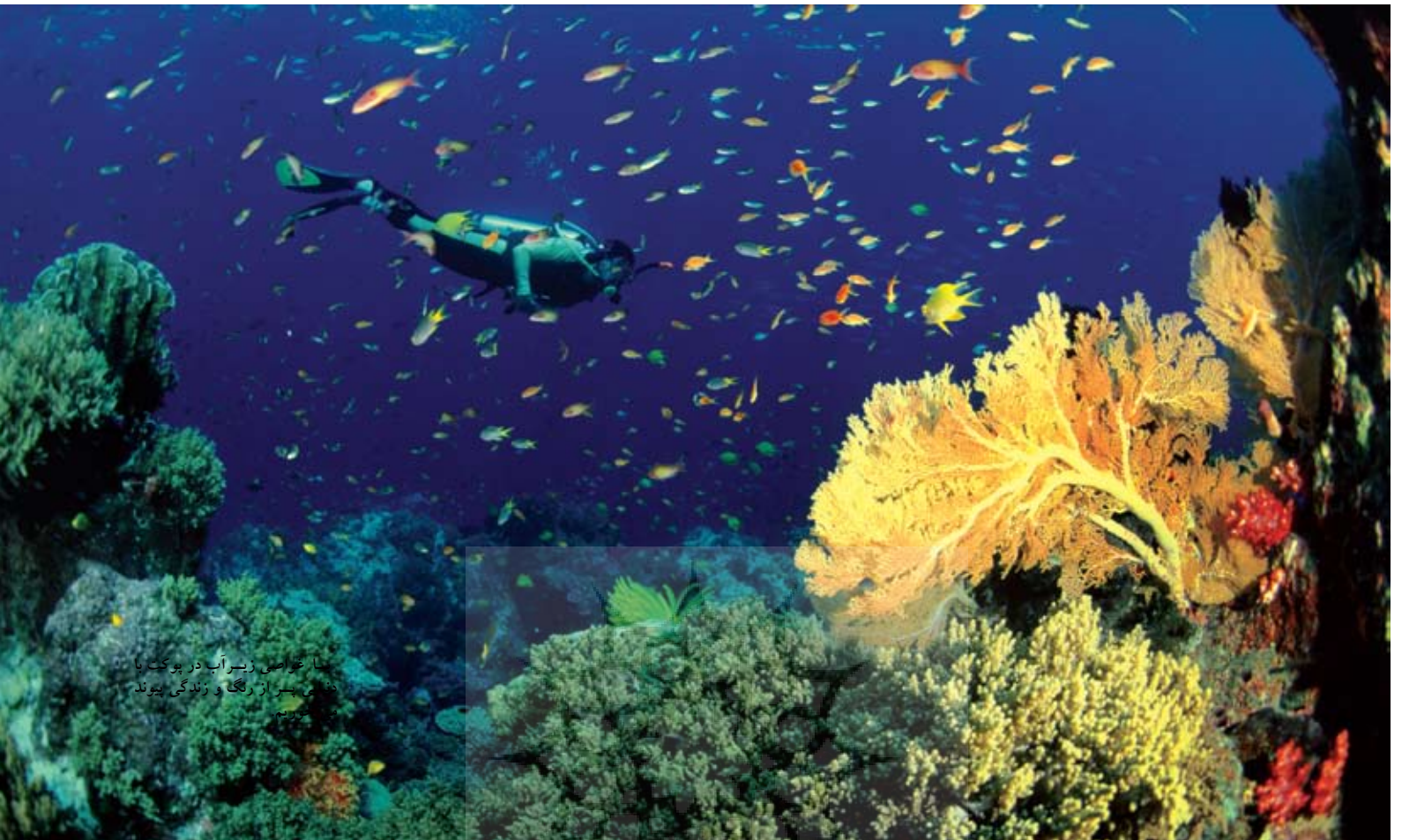
ما عوامین زیرآب در بوکت با دنیای بی‌از رنگ و زندگی بیوند تجربه می‌کنند

را برداشته بود. محصلانی که تمام ناره و حاکمی بود روح، ترشی و خیارشوری که مزه آن یاد ترشی اندازی های مادر بزرگ را زنده می‌کرد.