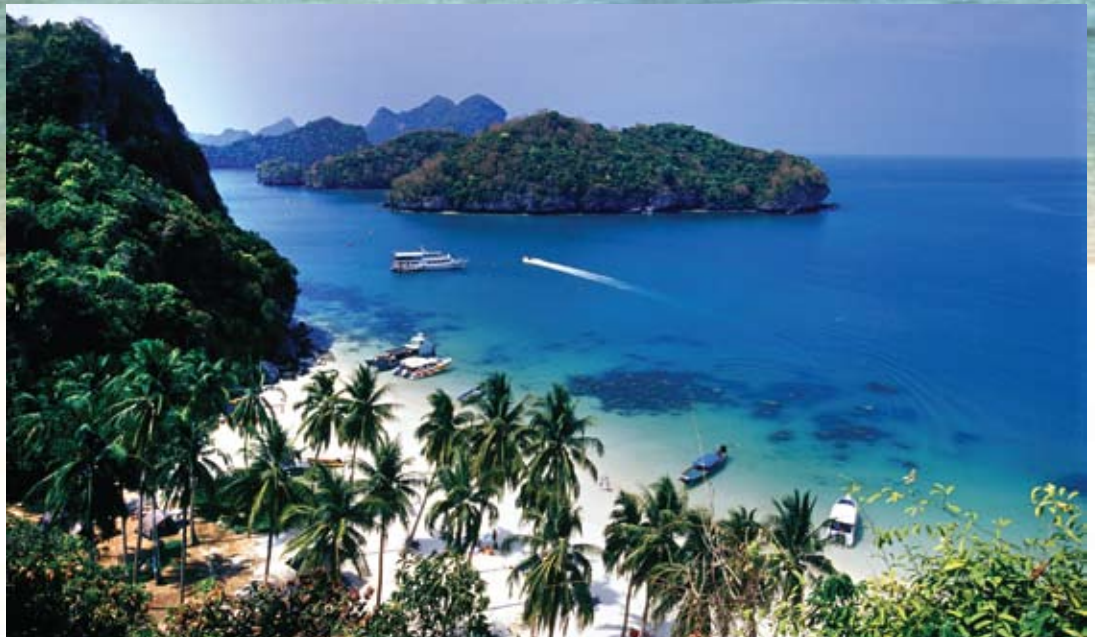
سواحل نقره فام پوکت.

شهرستان علم، هنر و مطالعات فرهنگی پرتال جامع علوم انسانی