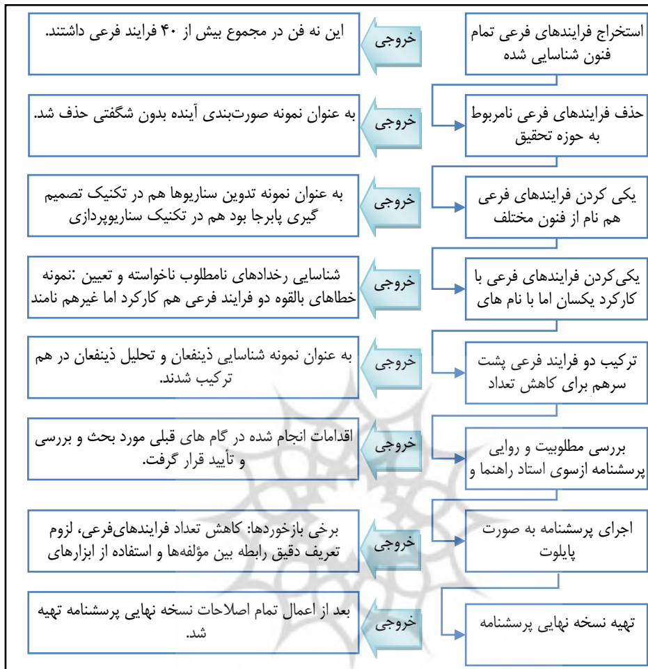
شکل ۲. فرایند طراحی و نهایی سازی پرسشنامه

صورت گرفت. سپس ترکیب دو فرایند فرعی پشت سرهم برای کاهش تعداد فرایندهای فرعی انجام شد. مطلوبیت و روایی پرسشنامه بررسی شد. پرسشنامه به صورت پایلوت تست و اصلاح شد و در انتها نسخه نهایی تدوین شد. اقدامات و خروجی‌های هر اقدام در شکل ادامه آمده است.