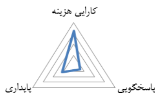
شکل ۱- جایگاه راهبرد زنجیره تأمین شرکت پتروشیمی