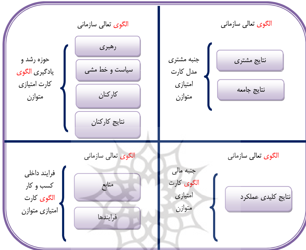
نمودار ۲. تلفیق الگوی کارت امتیازدهی متوازن و الگوی تعالی سازمانی از دیدگاه اولو و وتر [۱۲]

مکانیزم جامع تری که حاصل تلفیق این دو الگو است. به عنوان مناسب ترین الگو برای استخراج شاخصهای ارزشیابی کارکنان، استفاده شده است (نمودار ۲)