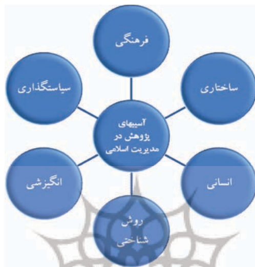
شکل ۳. عوامل آسیب شناسی پژوهش در مدیریت اسلامی

عامل انگیزشی: آخرین عامل از الگوی تحقیق هم افراد و هم سیستم های اجتماعی را در بر می گیرد و آسیب های ناشی از انگیزه های موجود برای پژوهش در حوزه مدیریت اسلامی بررسی می کند.