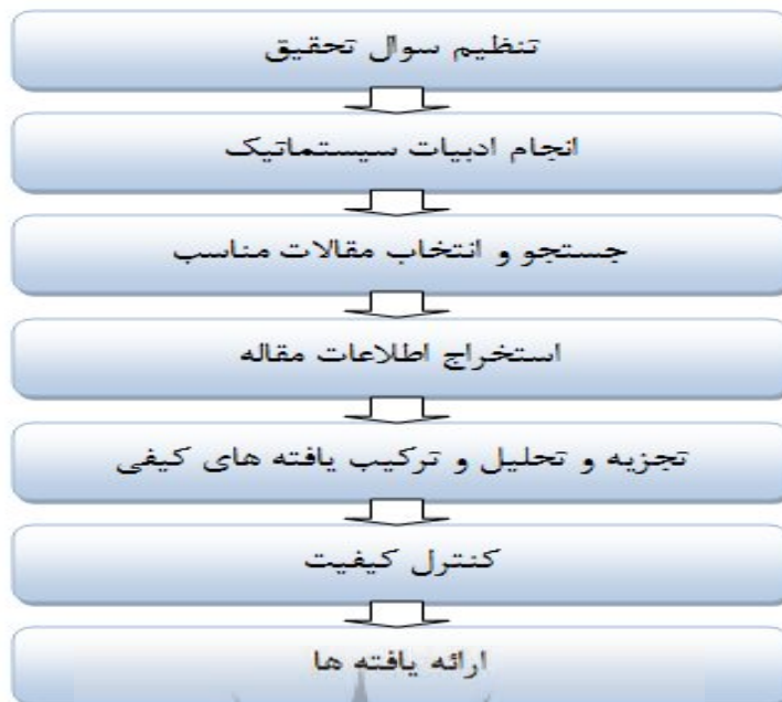
شکل ۲. گام های فراترکیب

برای گردآوری داده‌های پژوهش، از داده‌های ثانویه به نام اسناد و مدارک گذشته استفاده شده است. این اسناد و مدارک شامل کلیه پژوهش‌های صورت گرفته (اعم از پژوهشی و مروری) در زمینه پژوهش‌های مدیریت اسلامی بوده است. این نحوه گردآوری داده‌ها به تحلیل اسنادی نیز معروف است. در فرا ترکیب متن پژوهش‌های گذشته (اعم از مروری و پژوهشی) به عنوان داده‌ها محسوب می‌شود که دقیقاً همانند متن مصاحبه مستند شده است.