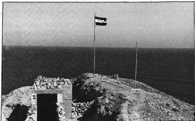
اهتزاز پرچم ایران بر فراز بلندترین بلندی جزیره ابوموسی