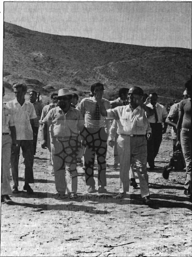
حضور استاندار بندر جنوب در جزیره ابوموسی