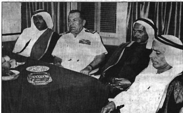
ملاقات شیخ صقر، برادر شیخ شارجه، با فرمانده ناو آرتمیس، جزیره ابوموسی، آذر ۱۳۵۰ (برگرفته از کتاب جزیره ابوموسی...)

نهم آذر ۱۳۵۰ از طرف دولت مرکزی ایران تأیید شد.