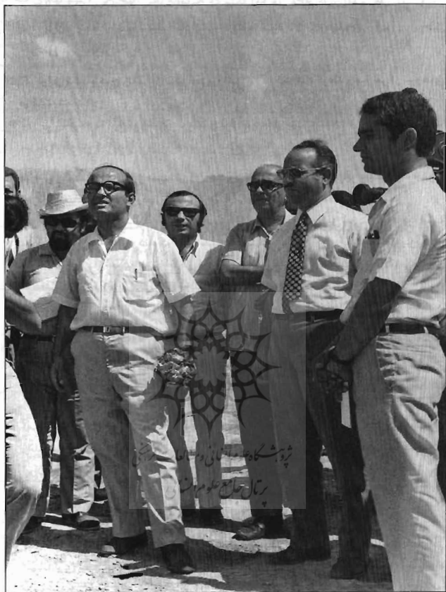
بازدید جواد تیریزی از جزیره ابوموسی