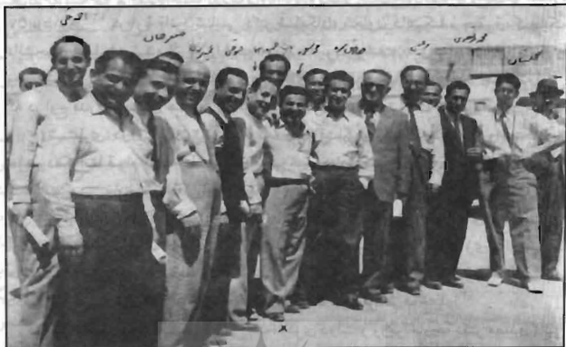
سفر روزنامه نگاران تهران به مناطق نفت خیز جنوب (۱۳۲۶)