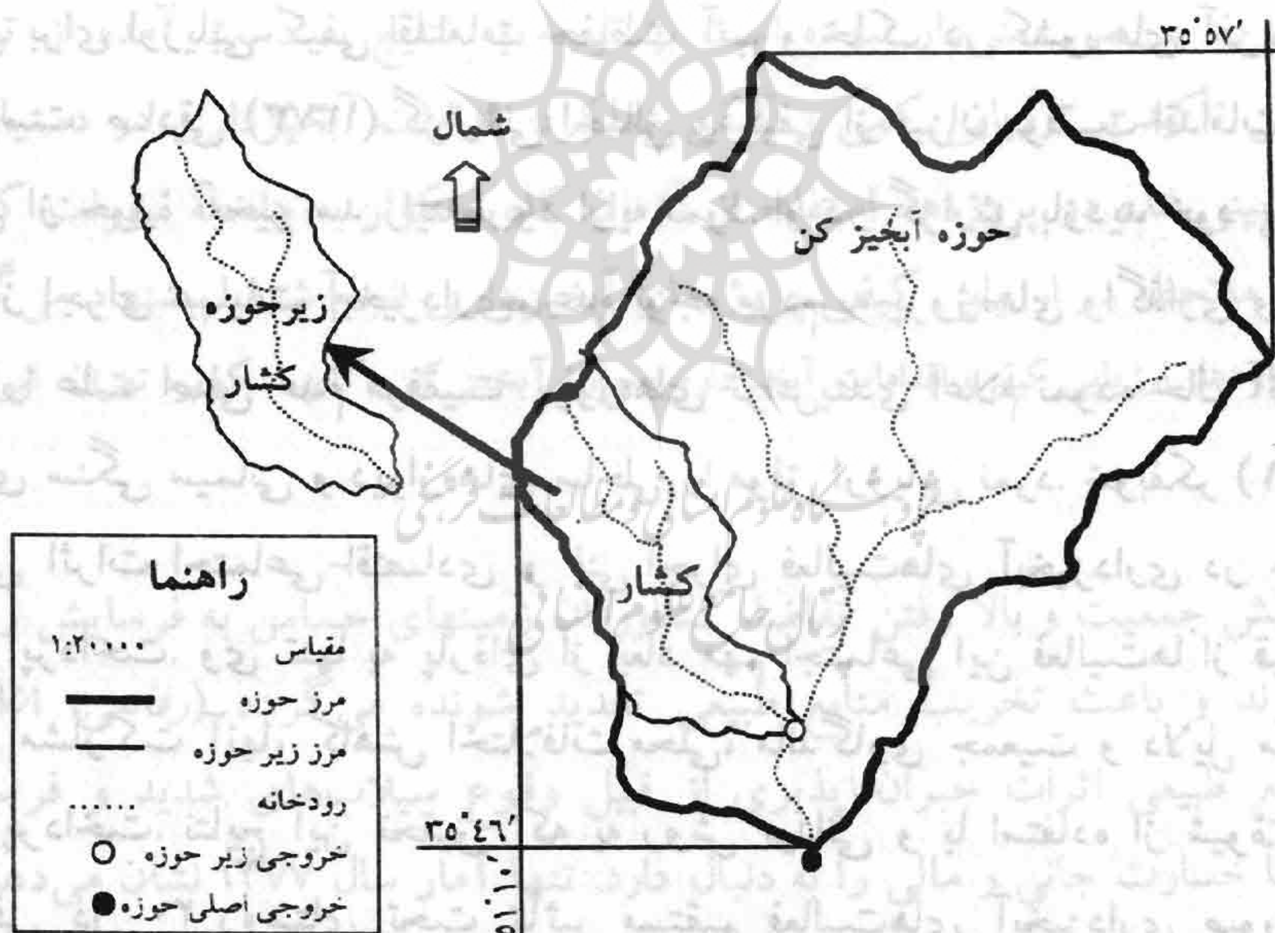
شکل ۱ نقشه منطقه مطالعاتی کشار در حوزه آبخیز کن

حوزه آبخیز کن که یکی از زیر حوزه‌های آبخیز مرکزی کشور محسوب می‌شود، در استان تهران واقع شده و از شمال به سلسله جبال البرز، از جنوب به شهر تهران، از غرب به کوه‌های پهن حصار و کدکو، از شرق به بند عیش منتهی می‌شود. این حوزه بین طول‌های جغرافیایی 51^{\circ}10' تا 51^{\circ}22' و عرض‌های جغرافیایی 35^{\circ}46' تا 35^{\circ}57' واقع شده است. کشار، سنگان، رندان و کیگا سرشاخه‌های مهم آن می‌باشند.