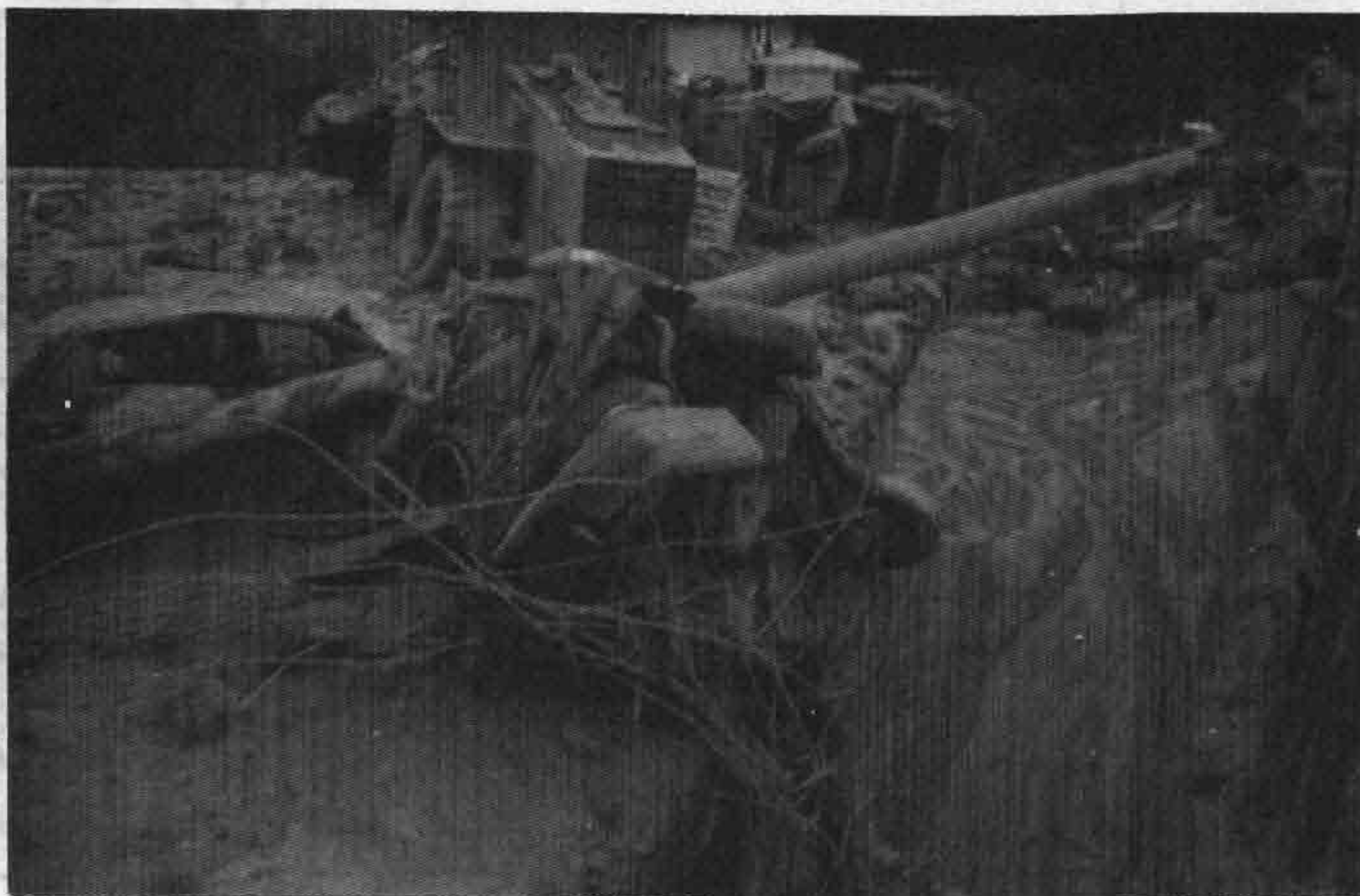
شکل ۲ دو نمونه از خرابی سیل مرداد ۷۷. بولدوزر بالای ساختمان!!