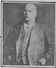
ویلیام ناگس داریسی

در سال ۱۸۵۵ میلادی یک زمین شناس انگلیسی به نام لفتیس برای نخستین بار جهت کشف نفت در ایران شروع به فعالیت کرد. (۱)