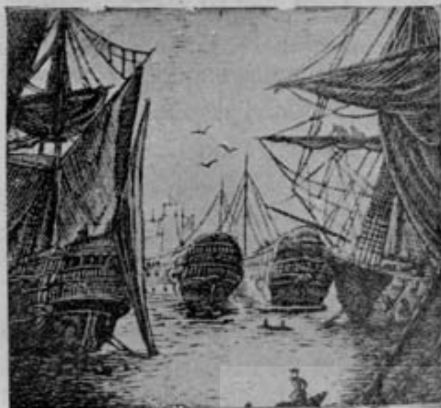
«روپسن کروزوئه» حکاکي روی چوب