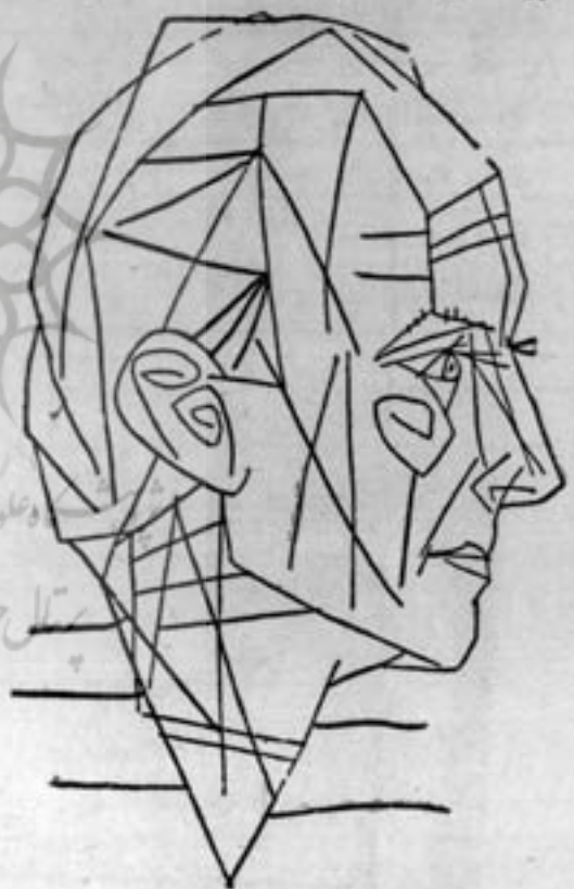
«معمادگاه آلمانی» تصویر