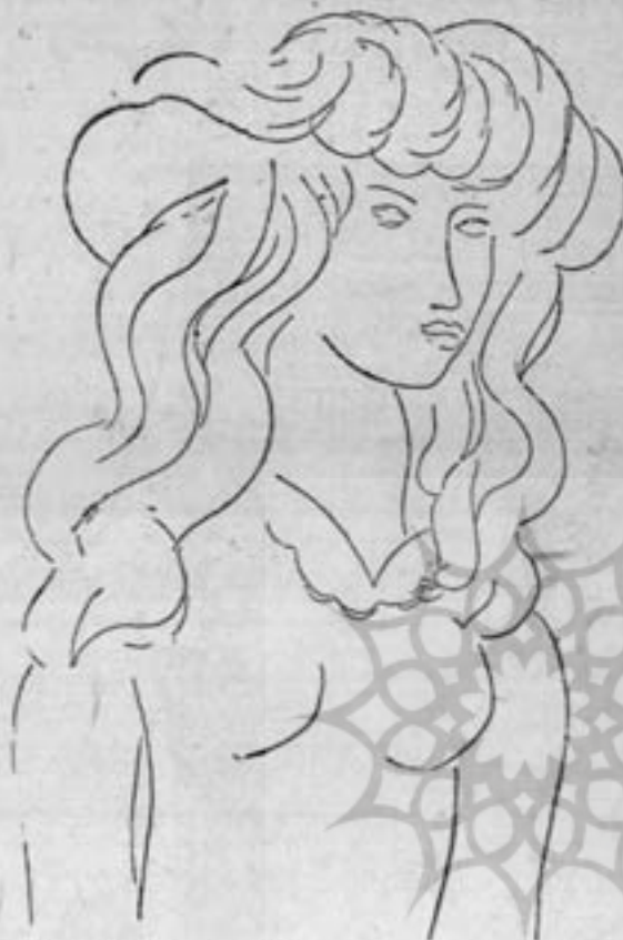
هنری مانیس «عالم شهود» از مالارمه کلیشه تیزایی

بعضی از ناشرین کتاب مجموعه‌های ذیقیمتی از کارهای این نقاشان تهیه کرده‌اند بطوریکه میدانیم چاپ