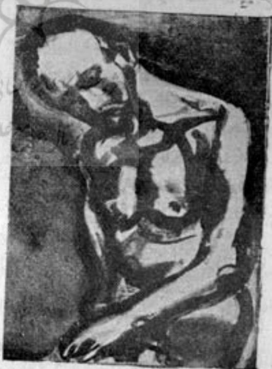
«پیشه سخت زندگی» کلیشه تیزایی

هنرمندان برای تامین منظور دوستداران کتاب که پیوسته در جستجوی نمونه های نایاب و ذقیمت میباشند فکر ایجاد کارهای رنگی از راه حکاکی افتاده و آثاری بسیار زیبا تر از کارهای ماشینی پدید آورده اند. به جرأت میتوان گفت که چهره های مختلف زیبا، اکنون در هیچ کجا چون در کتاب جمع آوری و خلاصه نشده است. کتاب امروز معرف مجموعه ای از حاصل تجربه های ممتدی است که تا کنون بعمل آمده و يك نوع فهرستی را تشکیل میدهد که هیچک از دوستداران نقاشی جز با صرف سرمایه ای هنگفت قادر به تهیه آن نمیباشند. چه کسی میتواند صدها تابلو از ماتیس، پیکاسو، لا بورور،