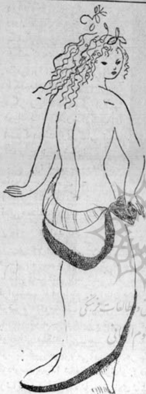
«منظومه» از سافو کلیشه تیزایی