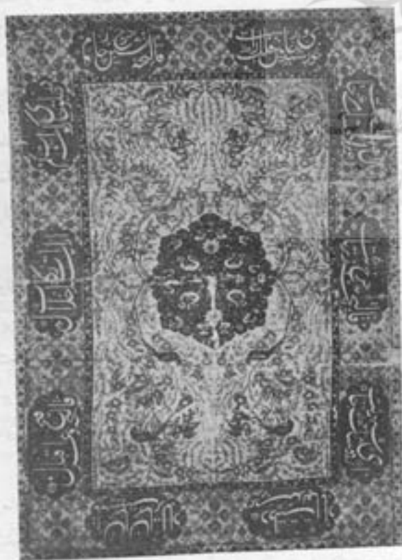
شکل ۱۱ - قالیچه ایرانشی که در قرن دهم هجری در تبریز بافته شده است