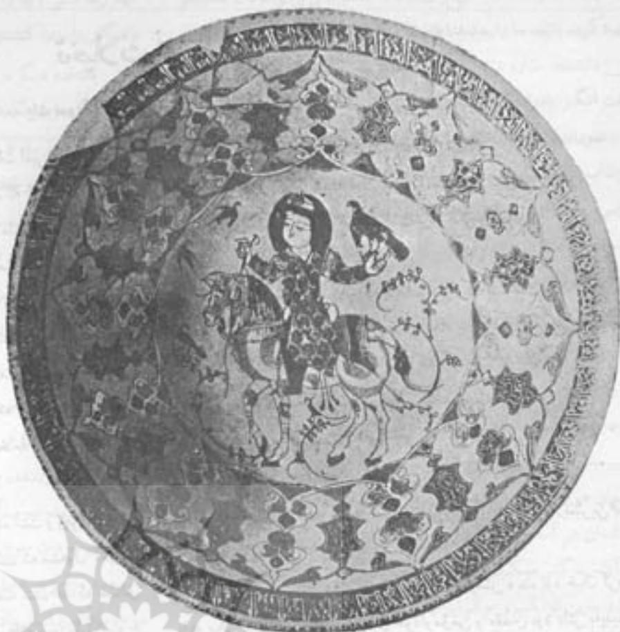
شکل ۹ - کاسه مینائی ساعت وی دوفرن ششم هجری (موزه ایران باستان)

قرون دوم و سوم هجری در نیشابور و سمره به نقش تصاویر زیبا در روی دیوار کتخای سلطنتی پرداخته اند و آثار آنرا آترمان در ضمن کوشهای علمی کم و بیش بدست آمده است. مهارت کامل و زیردستی این استادان در رنگ آمیزی نقوش ظریف ها بهیچوجه کمتر از نقاشی کتاب نیست، ظروف سفالی ساخت نیشابور و بالوان مختلف مزین بوده و بهترین شاهد این مدعا است (شکل ۷).