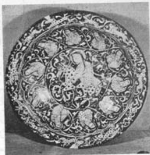
شکل ۱۰ - بشقاب کاشی ملانی ساخت ری (موزه ایران باستان)

استادان فن کاشی سازی سلع درون ظروف را مانند صفحه کتابی تزئین و زرینگار نموده و با وجود اشکالات ناشی از طرز کار