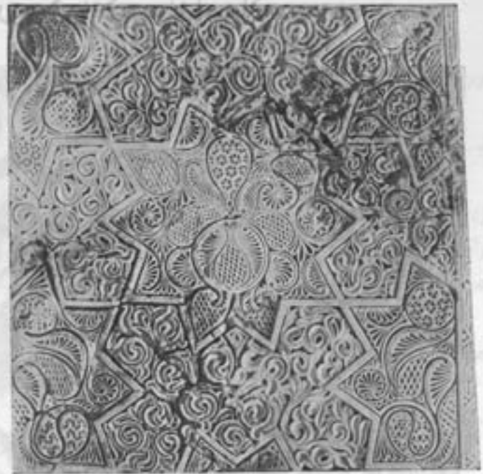
شکر ۳- کج بری کاخ سلجوقی در ری (موزه ایران باستان)

در کاخ ساسانی دامغان سورت خداوندان و حیوانات مقدس مانند گوزنی که سر خود را در کنار جویباری خم کرده باقیمانده است ولی مجالس شکار صورت و حیوانات گراز و خرس در جنگل و میشه و اشکال هندسی تزئینی بیشتر متداول بوده است. (شکل ۱۰) یکی از آنها بشقابی است سیمین و زر اندود که بنازگی در بازار فردین در دست کردی دیده شده و امروز در موزه ایران باستان محفوظ است. تصویر جلوس خسرو پرویز بر روی تخت مشهور خویش (طاق قدیس) که دو شیر در زیر آن قرار گرفته اند نقش این بشقاب را تشکیل میدهد. طرز قرار گرفتن سلطان که دو زانوی خود را بهم نزدیک نموده و شمشیری در میان کمر آویخته است و یا چهره و لباس دو نفر خادم که در حال ادب در دو طرف پادشاه ایستاده اند یا شیرانی که دست خود را در هوا بلند کرده هیچکدام از روی طبیعت اقتباس نشده بلکه منظور اصلی سازنده زینت سازی بوده است (شکل ۲).