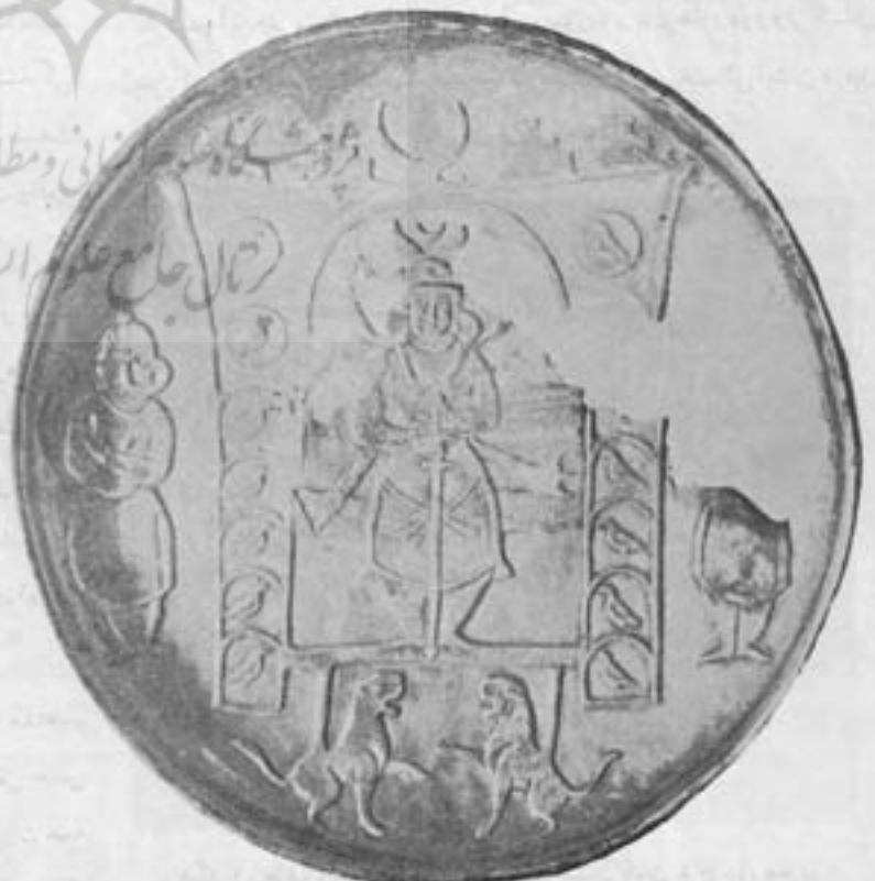
شکل ۲- شهاب سبینه زانوئود متعلق بزمان خسرو پرویز (موزه ایران باستان)

در انتخاب موضوع زیبایی نیز که گاهی خود را غفلت دلباخته می‌یثیم از خود اختیاری نداشته و اگر درست تأمل کنیم در اینکار عشان فکر و ذوق عمومی کمیت آنرا افزوده یا نقصان