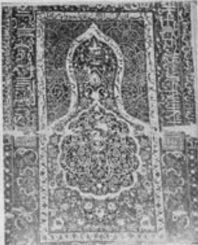
شکل ۱۲ - قابچه سجادہ پانت تبریز (موزۀ ایران باستان)

نقوش دیگری هم در همین مدرسه بدست آمده که با آیات قرآنی و کلهای ساده زینت شده و نوشته ای که بخط خوب کوفی دورا دور نقش و در میان گل و بوته دیده میشود فوق العاده بر حسن و زیبایی آن افزوده است.