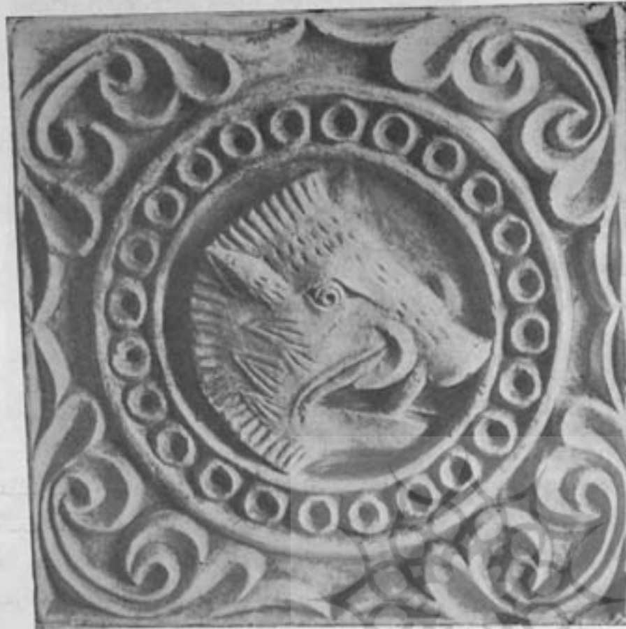
شکل ۱- کج بری دورهٔ ساسانیان که شکل گرا را برایش میدهد (موزه ایران باستان)

این برگزیدگان طبیعت هر روز پیام نازمائی از زیبایی می‌آورند و فصلی نوین از رموز آفرینش میکشایند اگر ایشان بودند هرگز کسی از تماشای حرکت موجهای دریا در زیر نور مهتاب و نالهٔ عاشقانهٔ بلبل و ناز و دلفریبی گل لذت نمیبرد. هنرهای ملی ایران نه تنها تحت تأثیر آسمان لاجوردی و مناظر زیبا واقع گردیده بلکه میل و سلیقهٔ عمومی نیز در آن تأثیر بزرگ کرده است. هنرمندان ایرانی با قوهٔ تخیل عالم ظاهری وجود را تغییر داده و بیکر نازمائی