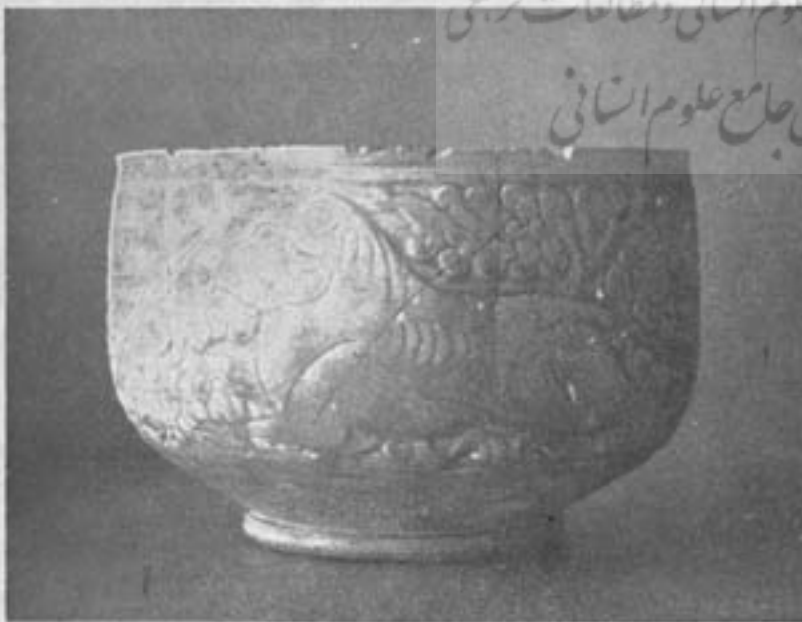
شکل ۸ - کاسه نپروزه رنگه متعلق برن ششم معری (موزۀ ایران باستان)

نمونه نقش تزئینی روی کجی در ضمن خاک برداری کارکنان موزۀ ایران باستان در ری بدست آمده و آن متعلق به مدرسه ایست که در اواخر قرن چهارم و عهد سلجوقیان ساخته شده است. نقش قسمت محراب آن عبارت از صورت دو قرقاول در میان گل و بوته های زیبا است و در زیر آنها گلبرگهای تزئینی در میان اشکال هندسی جا گرفته اند. در اینجا دم بهم بیجیده مرغان و حرکت سرشان بطرف زمین با مهارت کامل نموده شده است شکل ۴.