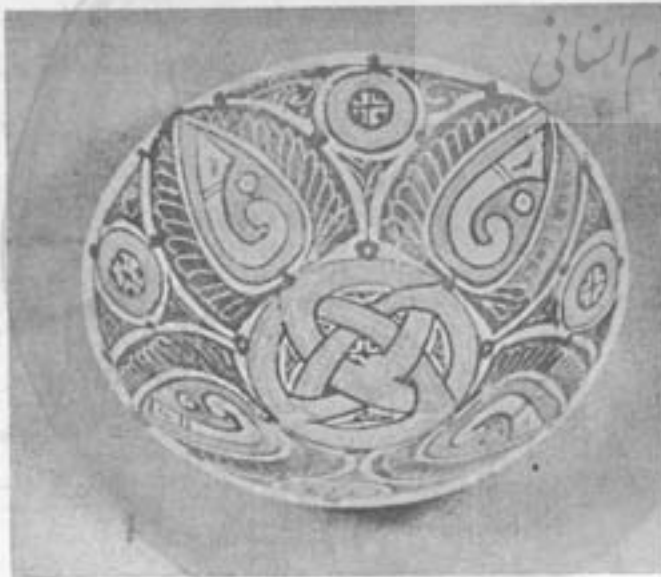
شکل ۶- طرف رنگارنگ سفالی سبک کار ترکستان متعلق بقرن سوم هجری

مذهب اسلام نیز باعث ارتباط و همکاری هنرمندان ایرانی با استادان ملل دیگر گردید. این هنرمندان از طرف روم شرقی و سوریه و با از خاور دور و ترکستان بمرکز دیار خلافت رو کرده در آنجا کار میکردند و برهنمائی ایشان در تیل بمقصود اصلی صنعتگران ایرانی بیشتر از آن حاصل گردید.