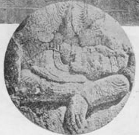
صورت مرد زیر پا افتاده

میدهد؛ اردشیر در میان ایستاده و اهورامزدا خدای بزرگ ایرانیان در حالی که روی خود را بطرف پادشاه کرده است حلقه ای را که در آن زمان جنبه پیمان مذهبی داشت بیادشاه میدهد لباس اهورا مزدا و