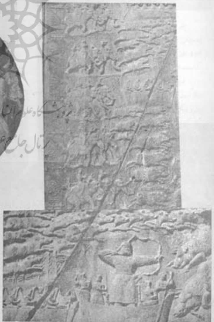
شکارگاه گرازا - پادشاه دو گرازا را شکار کرده است

پادشاه سورت (ناهیدنا) ربه النوع رود خانه ها و آبها رسم شده است سکه با ظرف آبی تزدیک پادشاه ایستاده و با دست راست خود حلقه یا تاجی را به خسرو پرویز عطا میکند. در این تصویر کلیه لباسهای شاه (قیاسلواز، شمشیر، کمر) غرق جواهر و چند رشته مسروارید نیز بر گردن او آویخته شده. اهورا مزدا نیز شلی بردوش دارد که حاشیه آن جواهر نشان است.