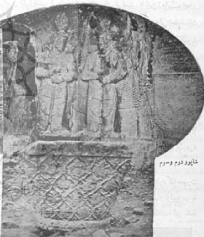
شاپور دوم و سوم