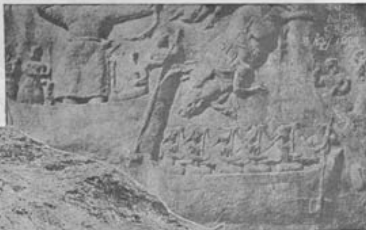
دور نمای طاق :

پس از سنگتراشی صفحه صاف کوه - طاق کوچک قرار دارد که صورت دو پادشاه را ایستاده و بطور برجسته نمایش داده است . هر کدام از این دو به جلوی خود نگاه میکنند و خوب بختانه در پهلوئی هر یک کتیبه ای بخط