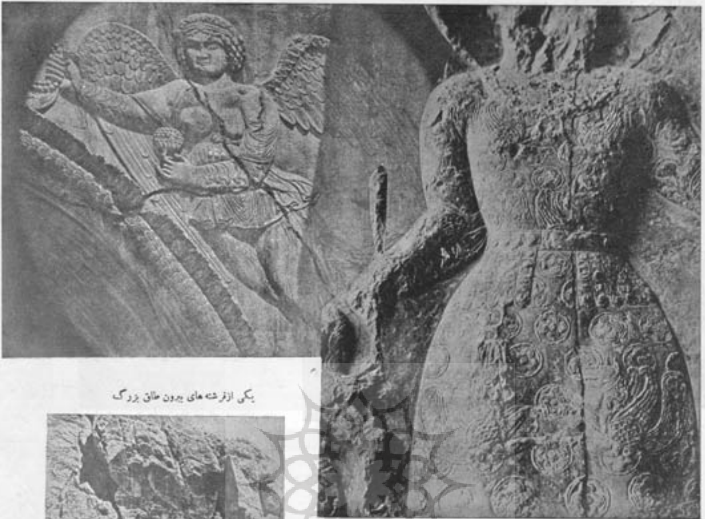
یکی از فرشته های بیرون طاق بزرگ