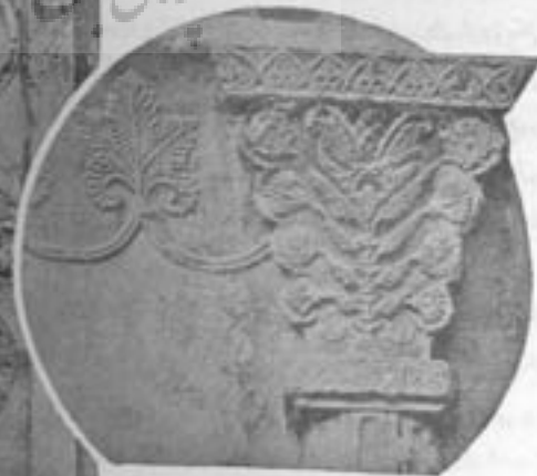
طاق بزرگ - سر ستون و تزیینات داخلی

حجاری این شکار گاه فوق العاده طبیعی و زیبا ساخته شده و بخوبی پیداست که استادان هنرمند ساسانی در طبیعی ساختن حرکات و حالات حیوانات و وضع امواج آب و تصویر ماهی ها و