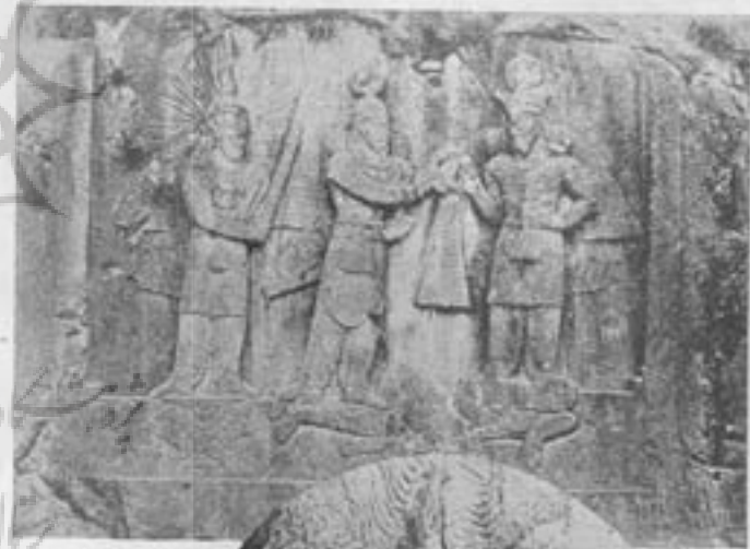
اهور مزدا اردشیر دوم - مهر

در باب نام آن بین جغرافی نویسان اسلامی و جهانگردان مشهور عقاید زیاد اظهار گردیده ولی درست آنستکه چون این آثار بزرگ در نزدیکی دیه و ستام واقع شده باین جهت بطلق و ستام و یا (طاق بستان) اشتهار یافته است . قدیمترین آثار تاریخی این محل صورت چهار نفر مرد است که بر روی سطح صاف کوه حجاری شده و تاجگذاری اردشیر دوم پادشاه ساسانی را نشان