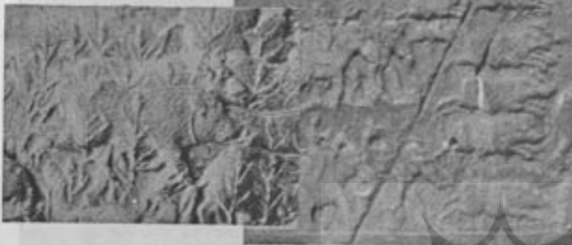
پیمان گرازا و اهورا مزدا