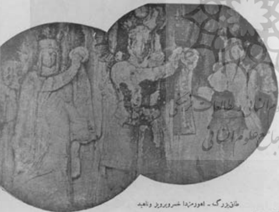
طاق بزرگ - اهورا مزدا خسرو پرویز و ناهید

پادشاه سورت (ناهیدنا) ربه النوع رود خانه ها و آبها رسم شده است سکه با ظرف آبی تزدیک پادشاه ایستاده و با دست راست خود حلقه یا تاجی را به خسرو پرویز عطا میکند. در این تصویر کلیه لباسهای شاه (قیاسلواز، شمشیر، کمر) غرق جواهر و چند رشته مسروارید نیز بر گردن او آویخته شده. اهورا مزدا نیز شلی بردوش دارد که حاشیه آن جواهر نشان است.