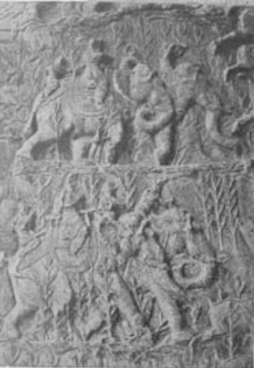
فیلیبان و فیلهای در حال حرکت