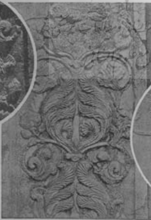
گل و بوته سنگی بیرون طاق بزرگ

ایجاد گردیده است به طوری که طاق بستان امروز گردشگاه عمومی مردم کرمانشاه و مسافرین داخلی و خارجی شده است. فضل الله حقیق